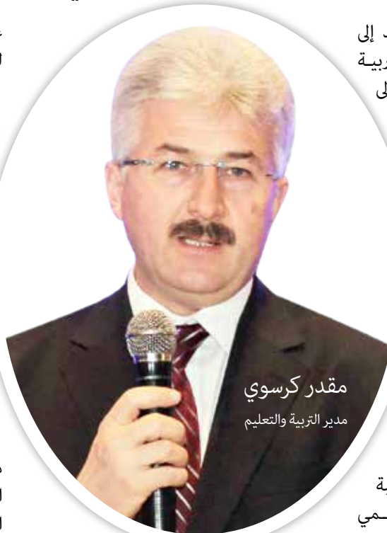
مقدر كرسوي مدير التربية والتعليم

نتائج امتحانات الانتقال من المرحلة الابتدائية إلى المرحلة الإعدادية. لن يكون هناك موعد آخر من أجل تحديد المدرسة. بينما تستمر عمليات الانتقال حتى آخر شهر إيلول الجاري. كما أننا فتحنا ٥ مشاريع مدرسية في تركيا إحداها ثانوية طاهر بيوك كوروكتشو أناضولو للأئمة والخطباء والتي ستقوم بتعليم اللغة العربية وعلى مستوى