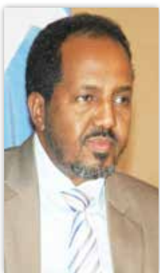
حسن شيخ محمود

ناشد الرئيس الصومالي حسن شيخ محمود المجتمع الدولي بتقديم خمسمائة مليون دولار لمواجهة الاحتياجات الضرورية للبلاد التي تعاني من آثار حرب طويلة ومدمرة. وقال شيخ محمود في كلمته أمام الجمعية العامة للأمم المتحدة إن الوضع الإنساني في الصومال "لا يزال خطيراً للغاية".