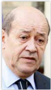
جان إيف لودريان

ألمح وزير الدفاع الفرنسي جان إيف لودريان إلى إمكانية قيام بلاده والأسرة الدولية بعمل عسكري في ليبيا، مؤكداً أن عملاً مشابهاً كُلف من قبله بالنجاح في مالي، مشدداً في الوقت ذاته على خطورة الأوضاع في ليبيا. وقال في مقابلة مع صحيفة لوفينغارد الفرنسية - إن على فرنسا أن تتحرك في ليبيا، وأن تعمل على تعبئة الأسرة الدولية حول مصير هذا البلد، موضحاً أنه بحث هذا الأمر مع نظرائه الأوروبيين خلال اجتماع غير رسمي في مدينة ميلانو الإيطالية. وأضاف أنه ينبغي أيضاً التوجه إلى منظمة الأمم المتحدة، مشيراً إلى أن اجتماع الجمعية العامة نهاية الشهر الجاري سيكون فرصة يجب اغتنامها لتناول الوضع في ليبيا. ورجح وزير الدفاع الفرنسي أن يتوسع الانتشار العسكري الفرنسي باتجاه الحدود الليبية، مضيفاً أن "كل هذا الأمر سيتم بالتنسيق مع الجزائريين".