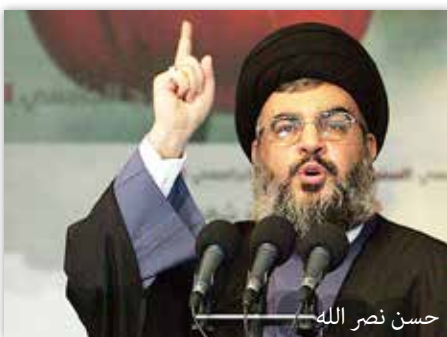
حسن نصر الله

وكان نصر الله وصف البحرين في كلمة له بـ"إسرائيل الثانية، وما يجري فيها شبيه بالمشروع الصهيوني، استيطان واجتياحا وتجنيسا".