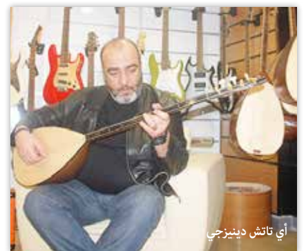
أي تاتش دينيزجي