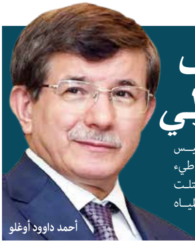
أحمد داوود أوغلو

جريمة ضد الإنسانية فان نتتياهو - كرئيس للحكومة التي تقتل أطفالا يلعبون على الشاطئ أثناء قصف غزة وتدمر آلاف المنازل، والتي قتلت مواطنين (أتراكا) في غارة على سفينة في المياه الدولية - ارتكب جرائم ضد الإنسانية