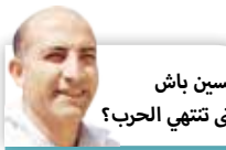
حسين باش متى تنتهي الحرب؟