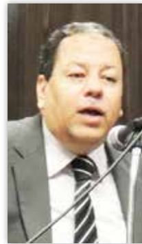
محمد شوقي العناني