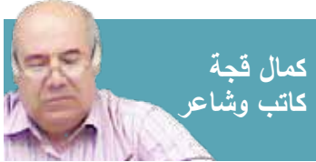
كمال قجة كاتب وشاعر