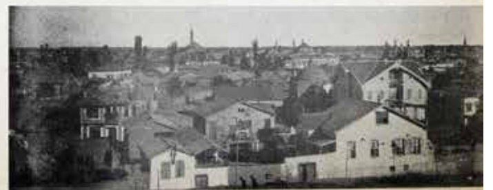
قیوسنک منظره مرمیریسی