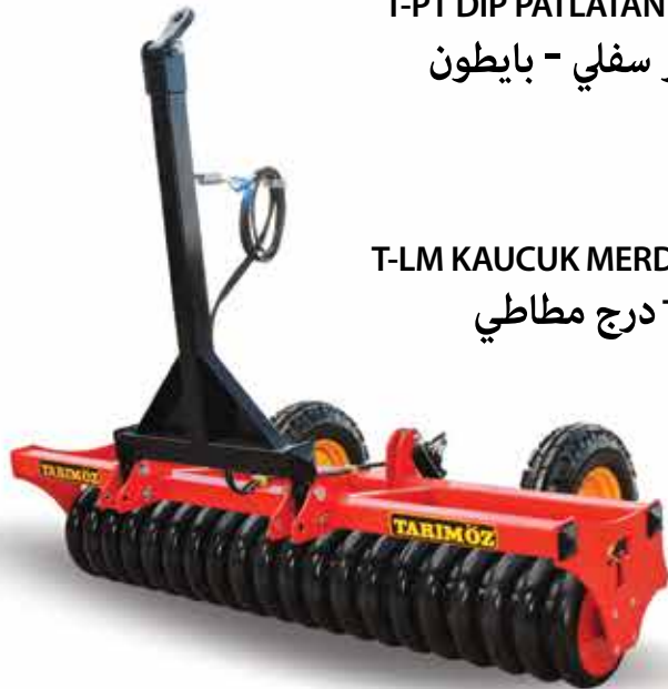
T-LM KAUCUK MERDANE T-LM درج مطاطي