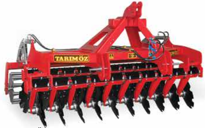
T-BG BAĞIMSIZ GOBLE EFE - TOPRAK CANAVARI T-BG جوبلة أفه المستقلة - وحش التربة