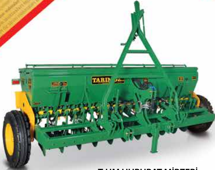
T-HM HUBUBAT MİBZERİ T-HM بذارة الحبوب

إذا أردت الابتسامة عند الحصاد استخدم تارم أوز عند الزراعة