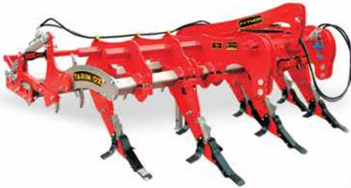
T-PT DİP PATLATAN - PYTHON T-PT مفجر سفلي - بايطون