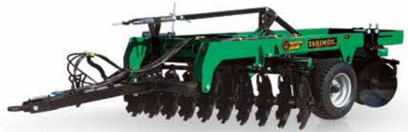
T-GD ÇEKİLİR TİP GOBLE DİSKAROW T-GD نوع السحب جوبلة ديسكارو