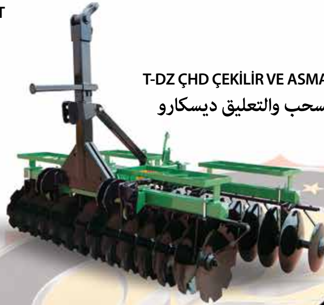
T-DZ ÇHD ÇEKİLİR VE ASMA TİP DİSKAROW T-DZ ÇHD نوع السحب والتعليق ديسكارو

Konya Organize Sn. Bölgesi İhsandede Cd. T : +90 332 239 00 71 bilgi@tarimoz.com.tr 12 Nolu Sk. No: 18 Konya / TÜRKİYE F : +90 332 239 00 74 www.tarimoz.com.tr