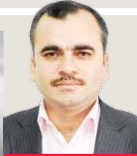
عدنان أبو عامر