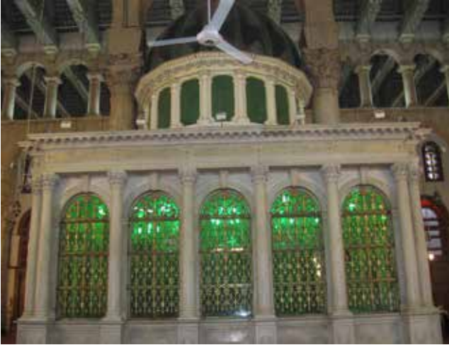
Şam, Hz. Yahya