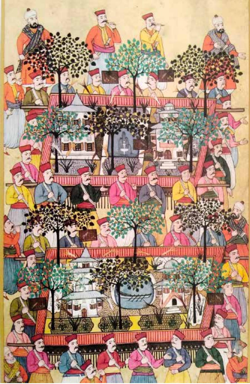
Sünnet düğünü boyunca İstanbul'un çeşitli yerlerinde gösteriler yapılırdı.

düzen kurulmuş; düğüncü başlığa Rumeli Beylerbeyi İbrahim Paşa, şerbetçi başlığa Sokollu'nun damadı Anadolu Beylerbeyi Cafer Paşa, muhafız başlığa Yeniçeri ağası Ferhat Ağa getirilmiş. Konuklara verilecek ziyafetlerde sadece pilav dağıtmak için 1.500 ba-