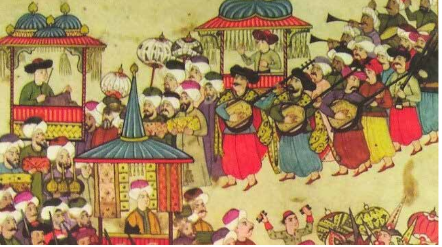
Sünnet düğününde esnaf alaylatının geçişi.