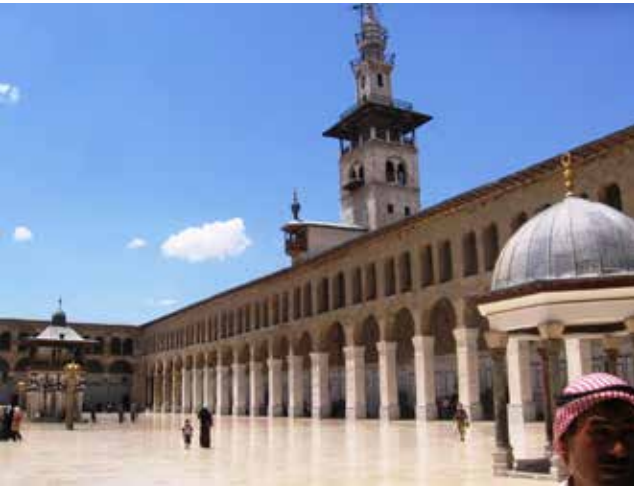
Şam, Ümmiyye Camii

hidi Halid ibni Velid'in türbesini ve yanındaki muhteşem camiini ziyaret ederek vakit namazlarımızı burada kıldık.