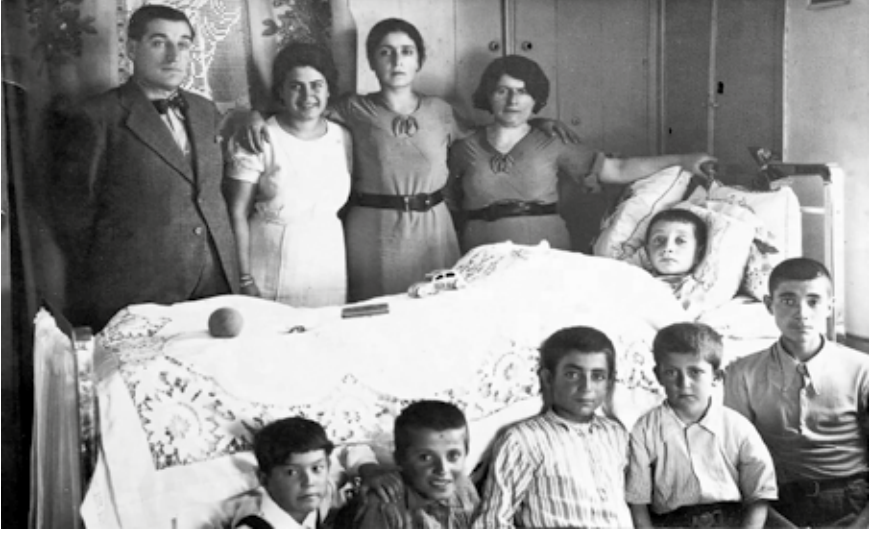
Ağabeyimin sünnetinden bütün bildiğim, annemin işlediği yatak takımlarının serili olduğu yatakta masum masum yatan, aile bireyleri ve birkaç arkadaşının yatağın çevresinde sıralandığı bu fotoğrafı...