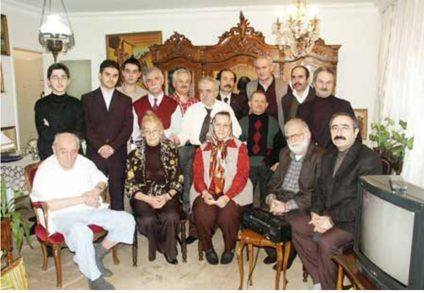
Ramazan ve Kurban bayramlarının ikinci günü ağabeyimin dostlarıyla bayramlaşma günüydü.