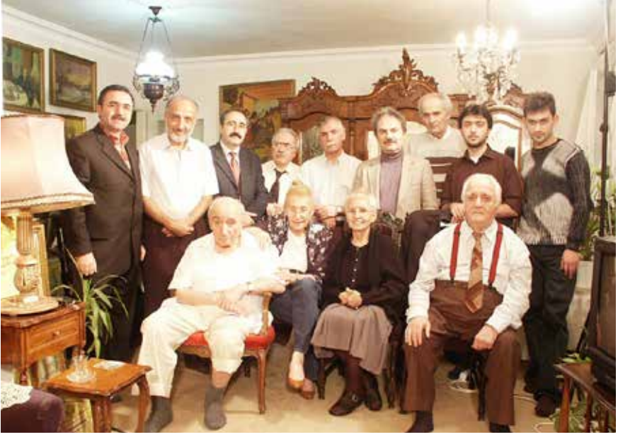
Bu da bir başka bayram ziyareti. Kısa bayram ziyareti olmazdı bunlar. Bayram ziyaretlerine kimi zaman canlı müzik ziyafetleri eşlik ederdi...

iri çiçekli kumaştan yüzleri olan puf minderleri... Bayılırdım bu puf minderlere ama oturmamak hiç nasip olmadı.