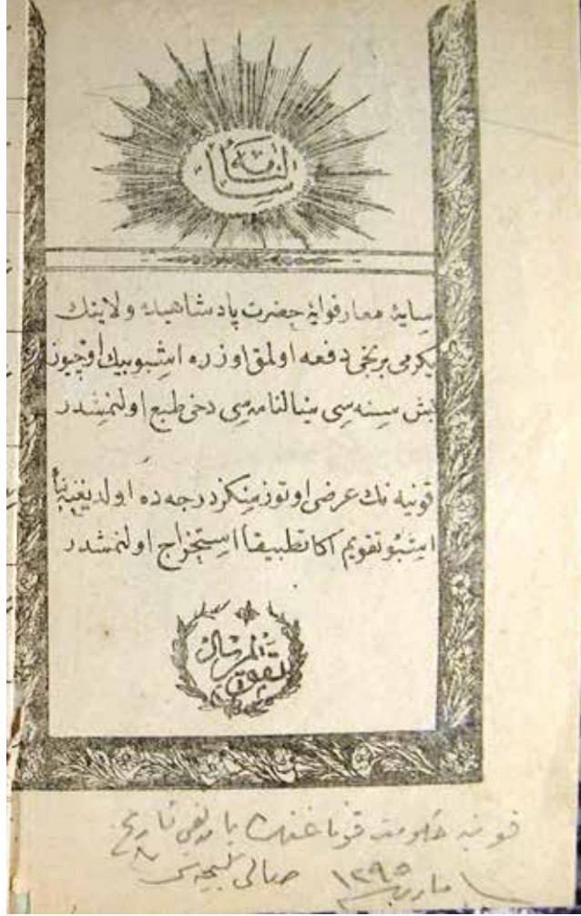
Hükümet konağı yangınının tarihinin not edildiği sayfa.

Ma'rûz-ı Çâker-i Kemîneleridir ki ... (5) Mâh-ı cârîniñ yigirmi dokuzuncu cum'a gîcesi sâ'at yedi sularında nefsi Konya çarşûsınıñ tâ vasatında vâki' Kapu Câmî-i şerîfine muttasıl bulunan çubukcu dükkânı zîrinde bulunan mahalle târî furûsuñ muntafî oldu kıyâsile bırakub gitmiş olduğu mankal-ı şerâre-i baş olmağla dükkân-ı mezkûruñ altından için için işleyen Âteş içinden birden fûrûzân ve hemân haber alınub âcizleri dâ'irem halkı ve mevcûd zabıtagân ile yetişmiş ve bezl-i