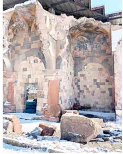
Anadolu'daki ilk Türk ibadethanesi olan Menuşehr Camii

Kars'a gezilecek bir başka yer de Çıldır Gölü. Biz orada olduğumuz süre içerisinde göl henüz tam anlamıyla donmamıştı. Daha sonra Aralık'ın sonuna doğru eksi 15 derecelerde donuyormuş. Göl üzerinde isterlerse atlı kızaklarla dolaşıyorlar veya yaya olarak da gezilebiliyor, tam bir kış eğlencesi. Yaz ve bahar dönemlerinde de gölde balıkçılık yapılıyor, yöreye ek gelir sağlanıyor.