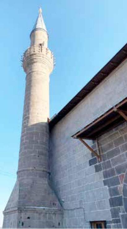
Ulu Camii'nin dıştan ve içten görünüşü

Bu lokanta da Ebü'l-Hasan Harakanî Hazretleri'nin türbesine dolayısıyla Kars Kalesi'ne oldukça yakın. Her dışarı çıkışımızda, yolumuz bir şekilde hazretin türbesine rastladı. Tekrar ziyaretimizi yapıp, yanındaki camide namazımızı kıldık. Karşısında gençler ve çocuklar için bir takım