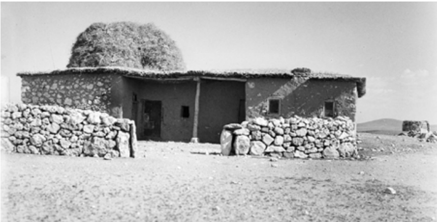
Başkuyu'da eski bir ev (Ananevi mimari)

1929 yılında 21 Teşrinisani [Kasım] tarihli ve 1351 sayılı Resmî Gazete'de yayımlanan 27 Ekim tarihli kararname ile Konya'da yeni nahiyeler kurulması yanı sıra ilçeler ara-