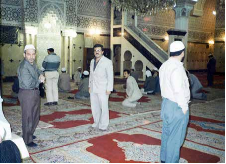
Şam Medine Uçağı) (İmam-I Aza'm Camii ve Türbesi Bağdat