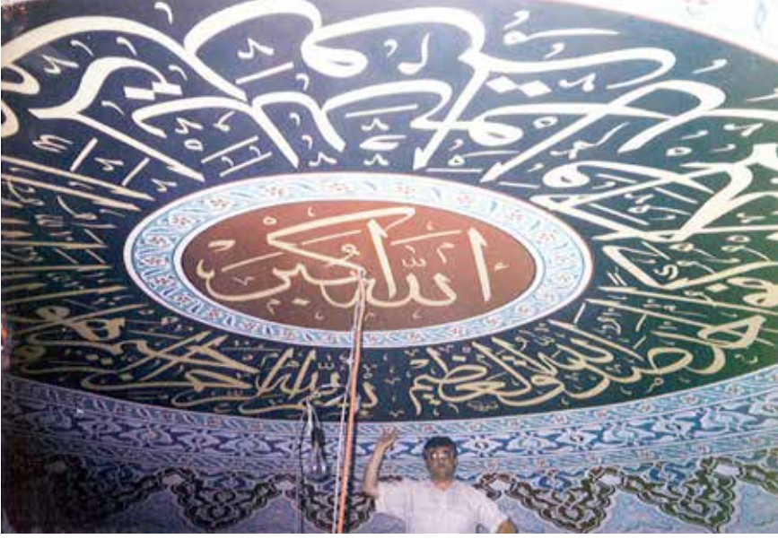
Avustralya Sidney’de Camii Kubbe merkezi yazı yazarken