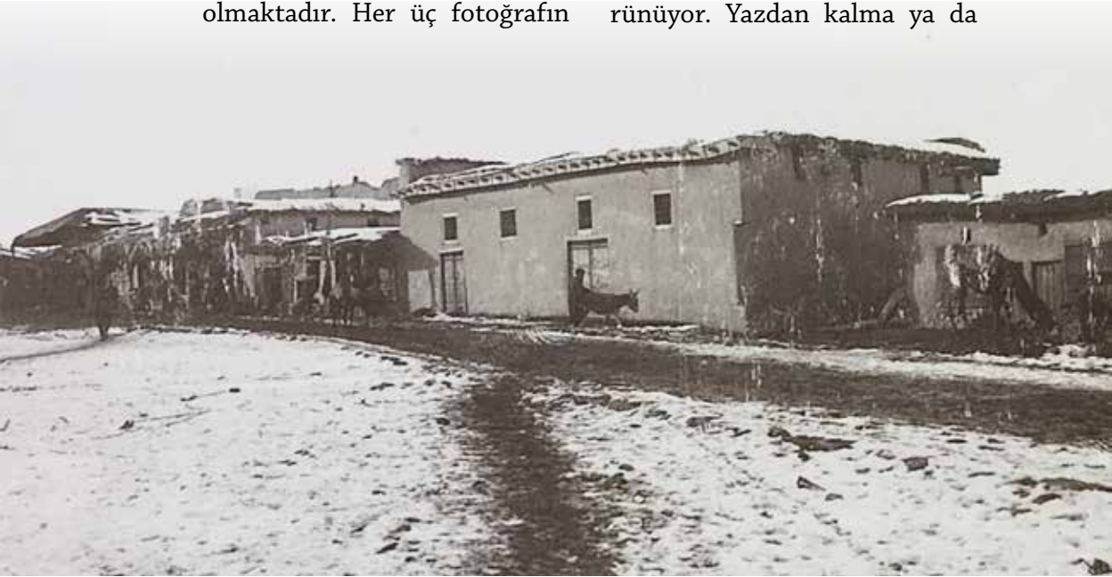
10/8/75a K 432 kerpiç evler ve Karamanlı insanlar

10/8/75a K 432 nolu fotoğrafın nereye ait olduğunu kestirmek imkânsız. Şehrin dış kenarı gibi. Fotoğrafların seri numarasına göre Oppenheim, Aktekke'den sonra bu mekânı çekmiş olmalı. O zaman burası, Aktekke'nin arkasında bir yer, belki de Araba Pazarı (1 Numaralı Aile HKasımlığı) taraflarıdır. 10/8/74c K 432 nolu Kadirhane Camii ve Kadirhane Sokağı fotoğrafı, bu fotoğraftaki mekânın neresi olabileceğine ipucu göstermekle beraber fotoğrafın seri numarasına göre de burası Kadirhane Camii'ne yakın bir sokak gibi durmaktadır. Öndeki kerpiç binanın çamur sıvası yepyeni gibi görünüyor. Yazdan kalma ya da