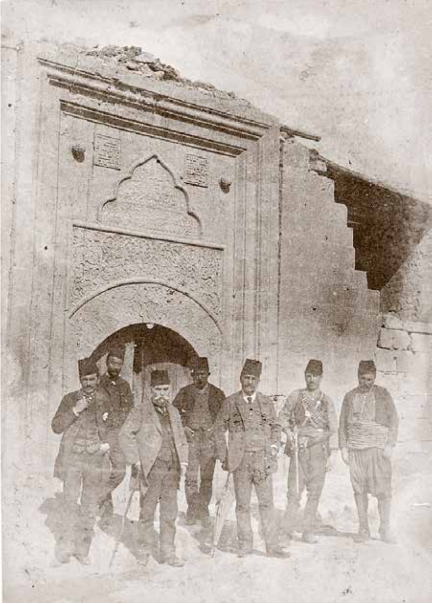
Hacı Beyler Camii, Leon Berger 1889

toğrafın sağına girmiş. Burasının bir çarşısı olduğunu gösteren bir diğer öge de öte beri giden insanlardır.