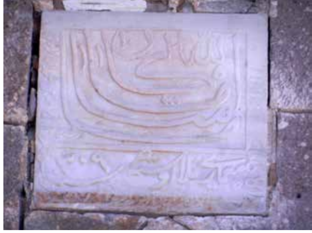
Karaman Belediyesi ilk bina kitabesi

lâhû mâ kâne" duası, kitabenin ana bölümünü oluşturuyor. Binanın inşa tarihi kitabede üç ayrı takvimle atılmış. Miladi 1891 tarihi kitabenin sağ kenarının altına dik yazılmış. Diğer tarihler; 1307 Rumi 1309 Hicri. Sol kenara dikey "(.....) Timurcızâde? Hacı Nur? Ağa Emânî" metni yazılmış. Timurci yani Demirci. Hacı Nur Ağa'nın