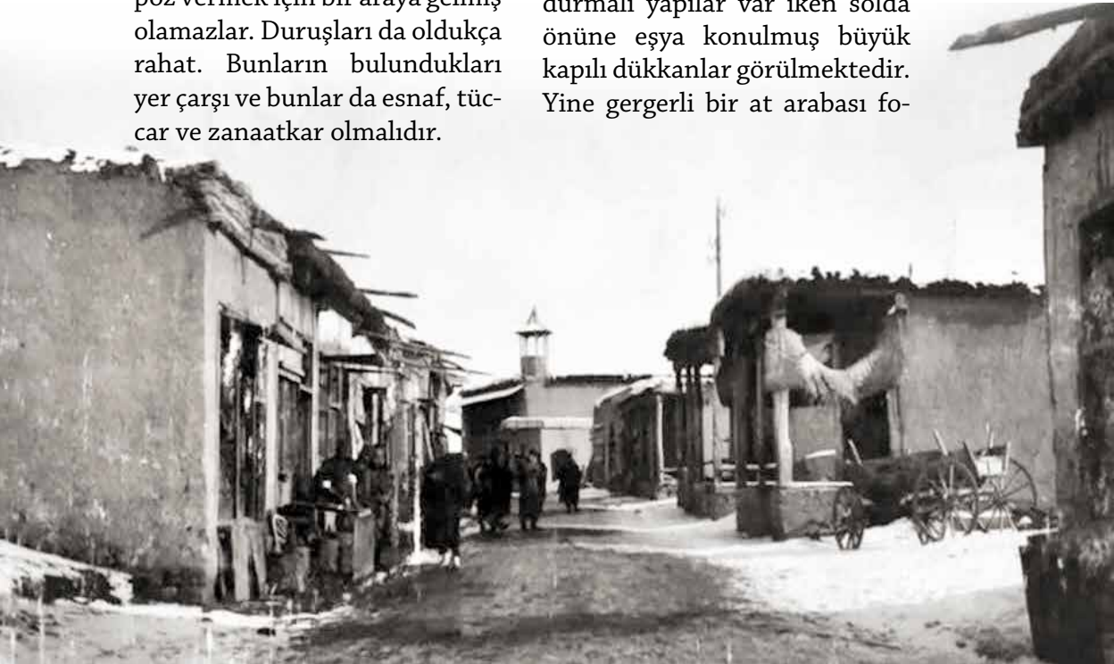
10/8/74c K 432 Kadirhane Camii ve Kadirhane Sokağı

Fotoğrafın daha ilginç özelliği ise bu sokağın bir çarşı olduğudur. Sağdaki sıra sıra sundurmalı yapılar var iken solda önüne eşya konulmuş büyük kapılı dükkanlar görülmektedir. Yine gergerli bir at arabası fo-