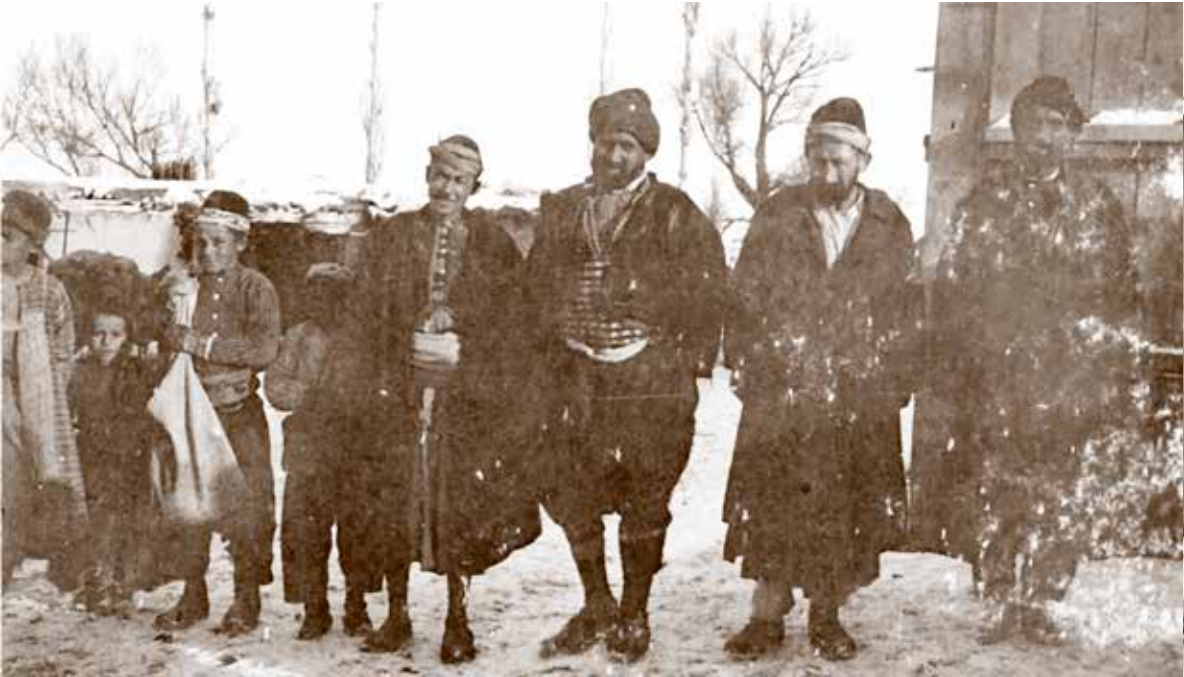
10/8/75d K 435 Karamanlı insanlar

10/8/75d K 435 nolu fotoğrafta 9 kişi var. Bunlardan beşi çocuk. En soldaki çocuk fotoğrafa yarım girmiş. Ortadaki kollu cepkenli iri kıyım adam, diğerlerinden daha fazla göze