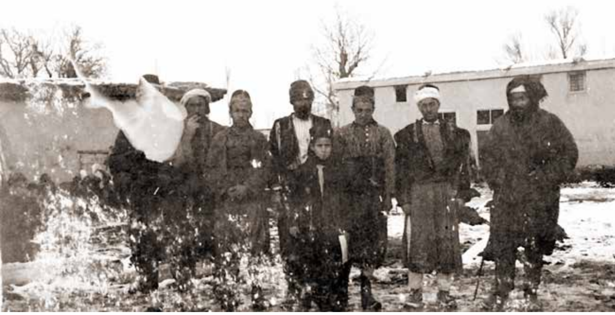
10/8/75c K 434 kerpiç evler ve Karamanlı insanlar

var. Sekizinci önde bir çocuk. En soldaki Karamanlı'nın baş tarafını, fotoğraf makinesinin merceğine yapışmış buz parçası olmalı, beyaz bir leke kapatıyor. Benzer biçimde fotoğrafın sol alt bölümüne de beyaz lekeler