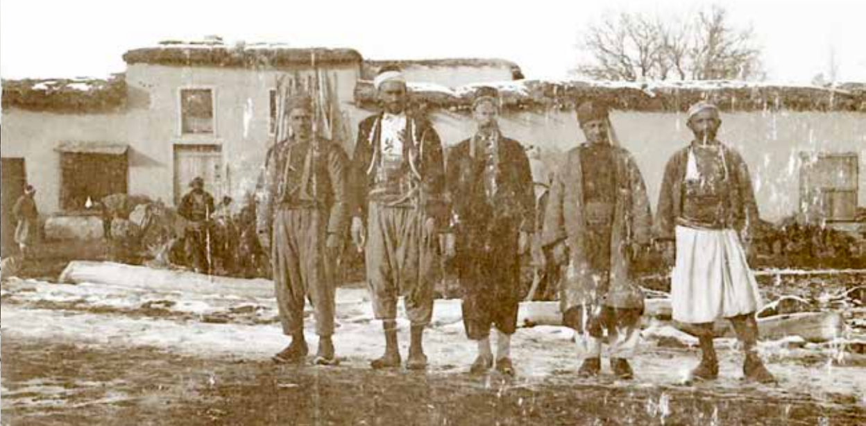
10/8/75b K 433 Karamanlı insanlar

10/8/75c K 434 nolu fotoğraf da bir önceki fotoğraftan farksız. Bu fotoğrafta sekiz kişi