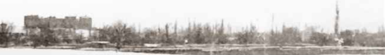
10/8/76a K 436 Karaman genel şehir manzarası, Max von Oppenheim, Karaman, 1899

rihte şehir, kaleden Paşa Camisi'ne doğu batı eksenli uzanıyordu. Şehrin güney kandanını oluşturan Çeltek, Gazalpa, Mehmet Bey, Zeyve Sultan ve Siyahser mahalleleri yayındaki bölge daha çok bahçe ve tarla durumunda olup yerleşim sınırlıydı. Kuzey kanattaki Emekseven, Alacasuluk, Hecce-ler, Valide Sultan, Kazımkarabekir mahallelerinin bulunduğu bölge de hâkezâ bahçe ve tarla alanlarıydı. 50 yaş ve üstü Karamanlıların hatırlayacağı üzere buralarda yapılaşma 80'li yıllar-