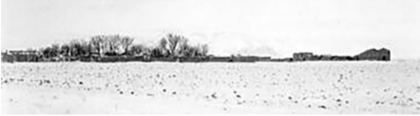
10/8/64c K 417 şehir genel görünüm

varlı bahçeler, arkadaki kerpiç binalar; Karaman şehir yapılaşmasının tamamına ipucu olacak özelliklerdedir. 10/8/65a K419 nolu fotoğraf kuvvetle muhtemel, kalenin şehri gören yönün-