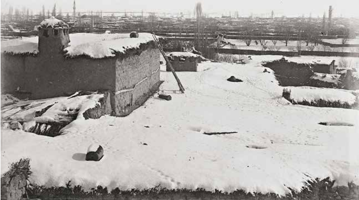
10/8/66b K 424 , 10/8/68b 1088 , 14 10/8/79a Kaleden genel görünüm Kaleden Karaman, Max von Oppenheim, İkinci Abdülhamit Fotoğraf Albümü

10/8/66b K 424 nolu kaleden şehri gösteren fotoğrafın bir kopyası da İstanbul Üniversitesi Kütüphane ve Dokümantasyon Başkanlığında II. Abdülhamit Koleksiyonu