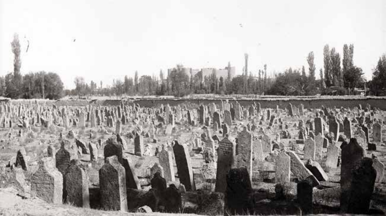
10/8/74a K 428 Hatuniye Mezarlığı

10/8/74a K 428 nolu fotoğrafın kadrajında belki 300'e yakın mezar taşı var. Bu yoğunluğa sahip olabilecek iki yer; Şehir Mezarlığı ile Gazalpa Mezarlığı olsa da burası, günümüze gelememiş, başka bir mezarlıktır. Bu mezarlığın ne ve nerede olduğuna, arkasındaki iki tarihi