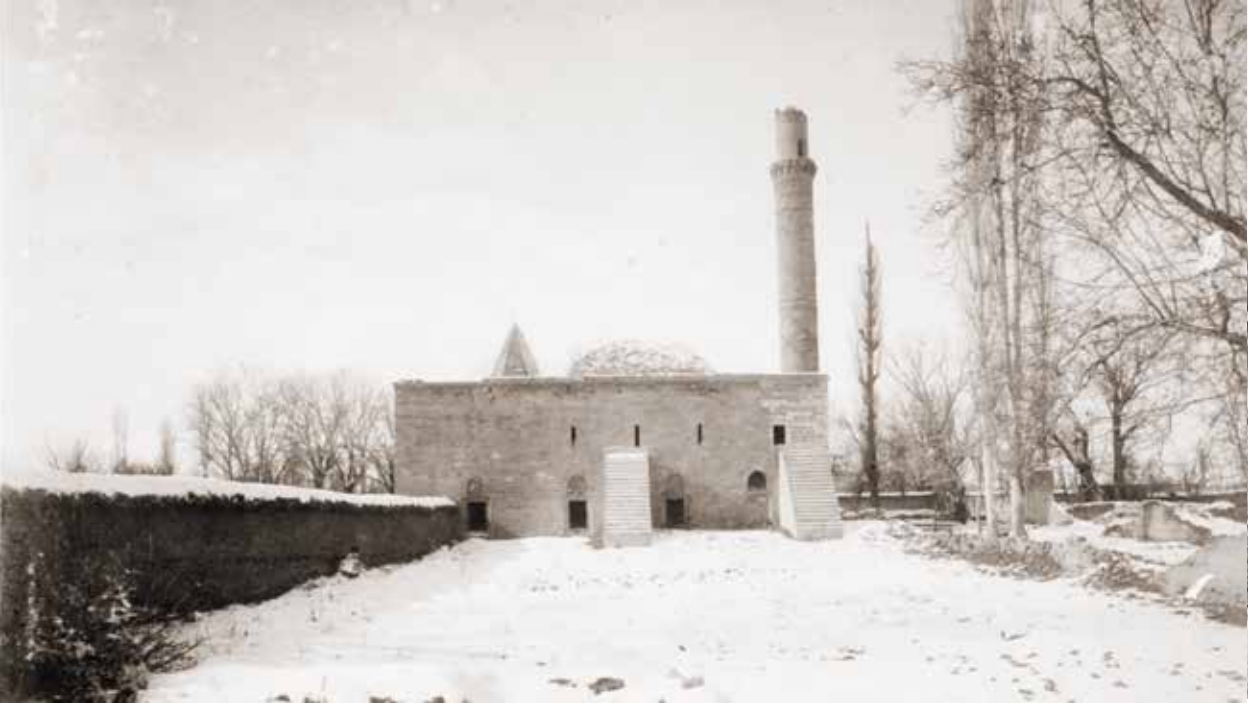
İmareti Cami, 1899

lünmüş bahçelerdir. Fotoğraf, neredeyse evler ve bahçeler biçiminde bölünmüş ve dizilmiş koca bir köy izlenimi vermektedir. Öyle ki, kaleden sonra başlayan bahçeler, bugün toprak bile görmenin imkânsız olduğu şehrin içine kadar sokulmuş görünüyor. Özellikle İbrahim Bey İmareti, Aktekke ve kale arasında İbrahim Bey İmareti'nin arkasına düşen bölgenin tamamen bahçe ve tarladan oluştuğu açıkça görülmektedir. Aslında şehir bu doğal yapısını 1970 ve 1980'lere kadar aşamalı korumuştur. İbrahim Bey İmareti'nin arkasındaki Höyük, Boklubent, Karadeğirmen, Gazalpa ve Akyokuş (Otogar) arasındaki geniş bahçeler Gödet Barajı yapıncaya kadar varlıklarını sürdürmüştü. Mersin yo-