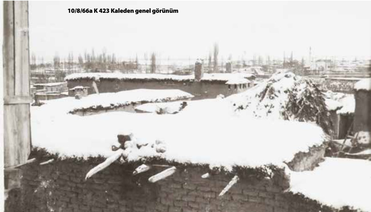
10/8/66a K 423 Kaleden genel görünüm

K 424, 10/8/68b 1088 ve 10/8/79a) milimetrik farklarla aynı görüntülerdir. 10/8/65d K 421 nolu fotoğraftaki yüksek bir minare, görüntüde belirgindir. Birbirine çok benzediğinden, -o zaman ayakta olan- Emir Musa Mescid/Medresesi'nin mi İbrahim Bey İmareti'nin minaresi mi olduğunu kestirmek zor