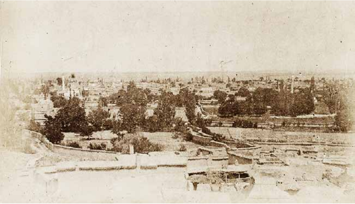
Karaman, Leon Berger 1889

Sokakta ikinci belirgin nesne; bir at arabası. Değişik bir araba. Fayton tekerli ama yaylı değil. Arabanın kasasına takılan yan kanatlar dışa eğimli, yüksekçe. Bu arabalar özellikle harman zamanı sap taşımak için kullanılırdı, o zamanlar. Kendi yüksekliğini üçe dörde katlayacak biçimde bu arabaya sap yığılır; ön ve arka tarafındaki açıklıklardan sap, saçak gibi sarkardı. Demir tekerlekli ilk traktörün Karaman'a, Hacı Sami Tartan eliyle getirilmesine 35-40 yıl vardır, daha. Bu arabanın Karaman'daki adı, gerger, gergerli idi. Remzi Tartan'ın