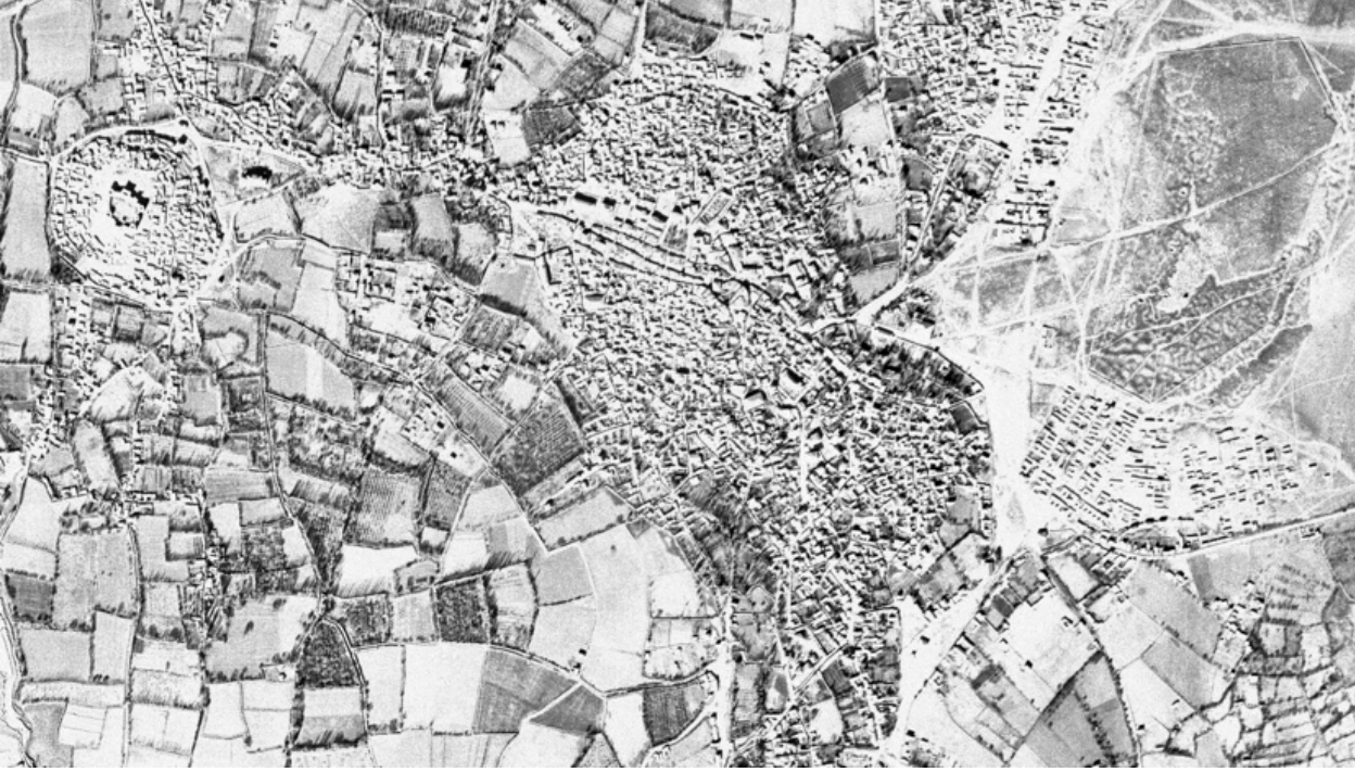
Havadan Karaman, 1955

kildiği sıraya göre seri numarası alması; yeri bilinmeyen sokakları konumlandırmada çok işe yaramaktadır. Buna göre Oppenheim, fotoğraf çekmeye kale ve çevresinden başlamış, sonra şehir merkezine yönelerek sırayla Hatuniye Medresesi, Aktekke, İbrahim İmaret, Belediye Meydanı (Cumhuriyet Parkı), Kadirhane Camii Sokağı'nı fotoğraflamıştır.