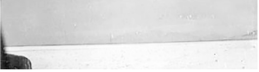
10/8/64d K 418 Karadağ manzarası, Max von Oppenheim, Karaman, 1899