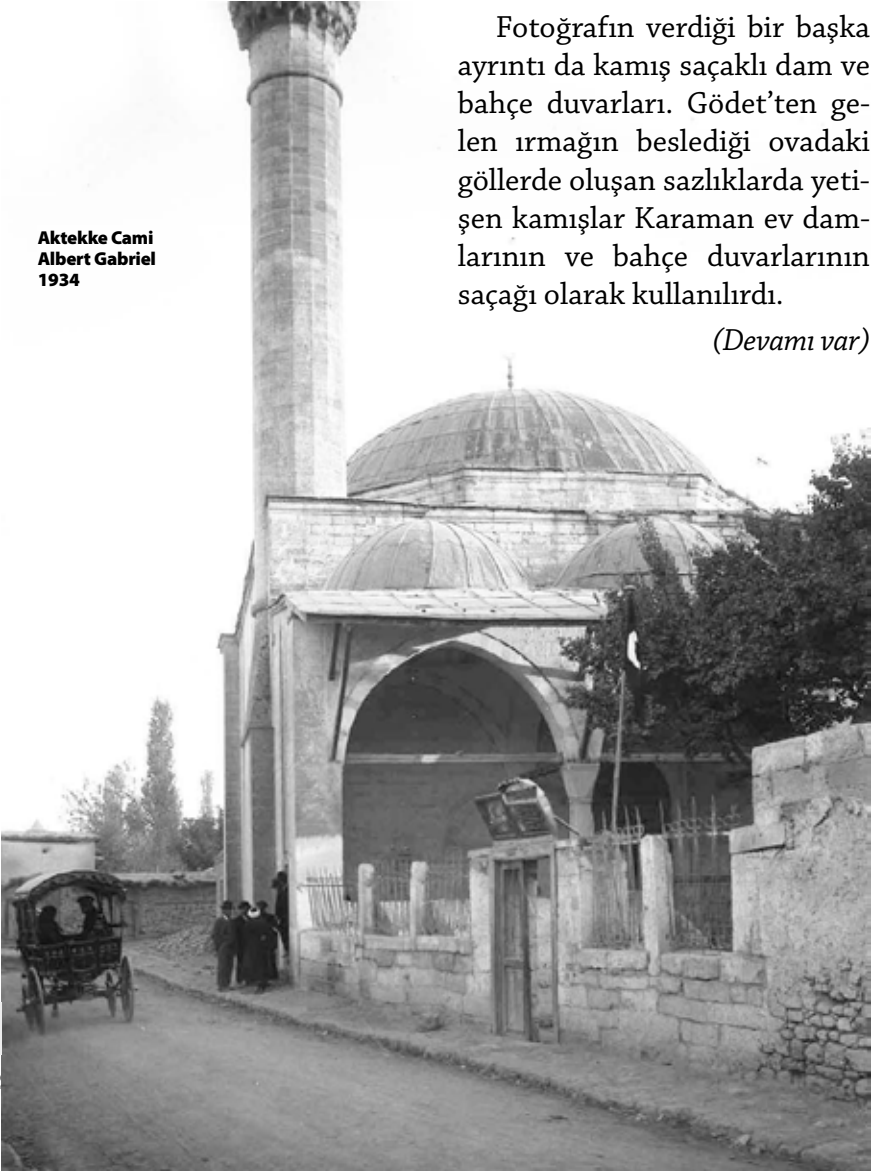
Aktekke Cami Albert Gabriel 1934