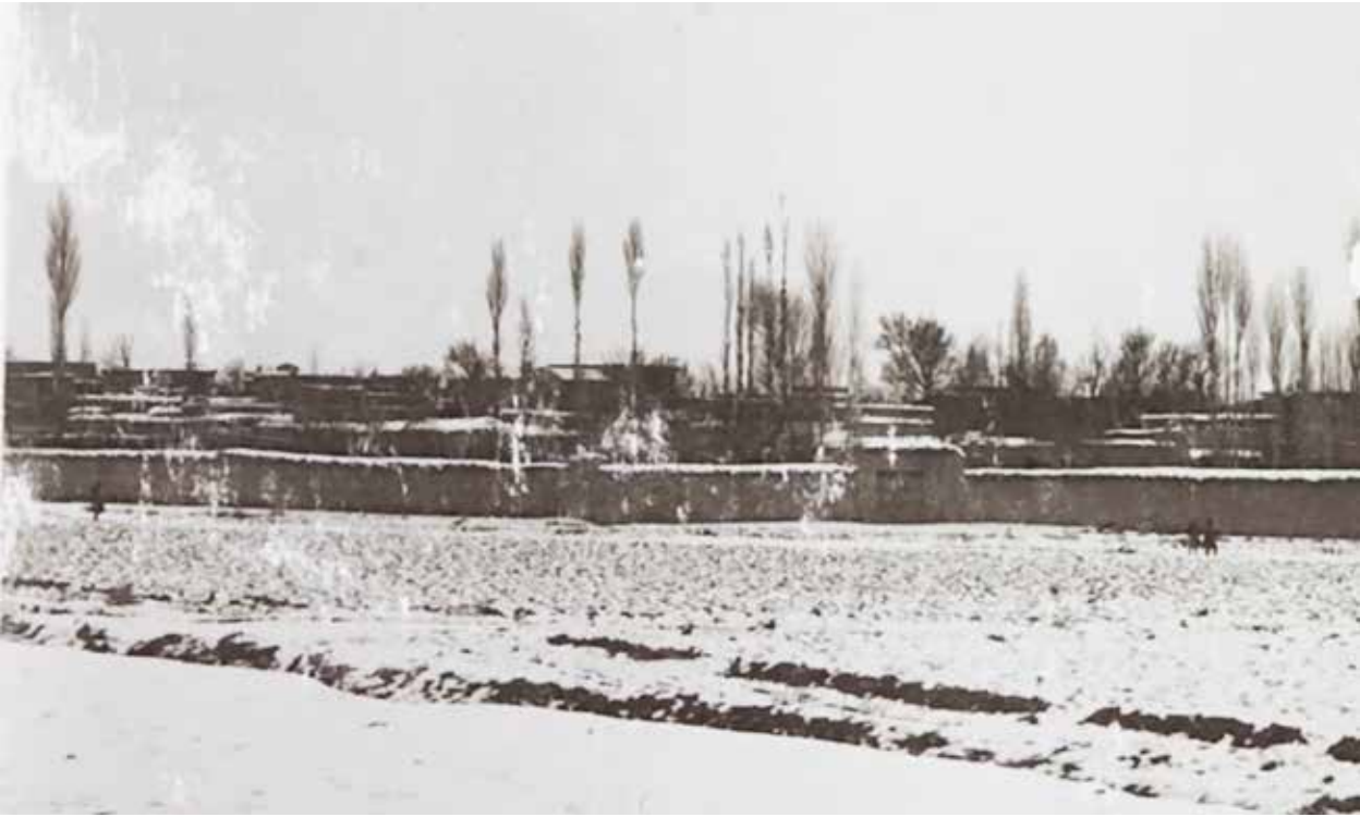
10/8/65a K419 şehir genel görünüm

18-19. yıllarda Karaman'a gelen yabancı seyyahların gözlemlerine göre Karaman; kerpiç duvarlı büyük bahçelerle çevrelenmiş kerpiç evlerden bir araya gelmiş harabe bir şehirdir. 10/8/65a K 419 numaralı fotoğraf şehrin bu özelliğini somutlar niteliktedir. Önde tarla, ilerisinde uzun ve yüksek du-