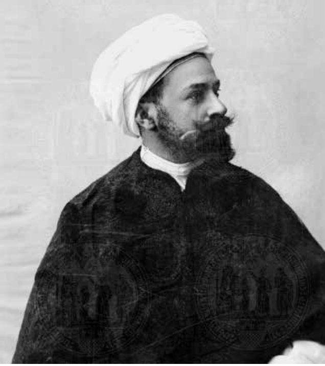
Max Adrian Simon von Oppenheim Tel Hallaf'ta iken

kültürel özellikleri anlatılmakta hem de diğer seyyahların notlarıyla bağlantı kurularak açıklamalar yapılmaktadır. Fotoğrafların seri numaraları ile çekim sıraları eş olduğundan anlatım, istisnalarla ilk fotoğraflardan başlanılarak yapılmıştır.