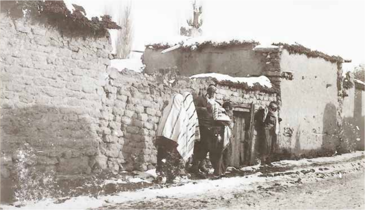
10/8/73c K 430 sokak ayrıntısı

Fotoğrafın asıl önemli özelliği, Osmanlı'nın Karamanlı kadın tiplerini kayıt altına almış olmasıdır. Fotoğraftaki kadın-