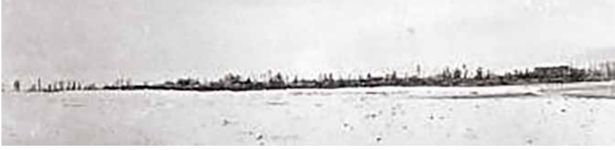
10/8/64b K 416 şehir genel görünüm