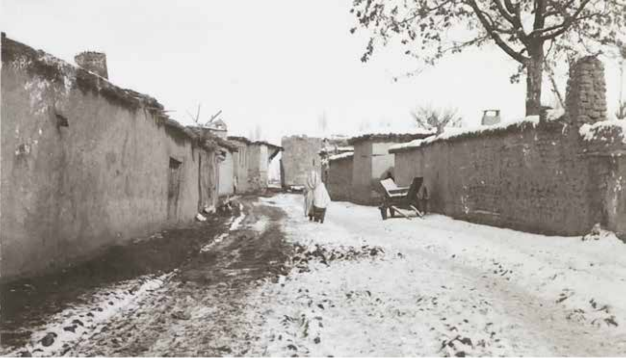
10/8/73b K 429 sokak derinlemesine görünüm

Sokak, sağlı sollu tek kat kerpiç binalarla sıralı. Ve her evin bir köşesine büyükçe köşeli baca çıkarılmış. Fotoğrafa girmeyen genel manzarada, evlerin arka kısmı sokağa bakarken ön kısımlarında avlulu bir bahçe bulunması doğaldır. Karla karışık donmuş çamurla kaplı sokağın ortasında öne doğru yürüyen beyaz poşulu ve şalvarlı bir ka-