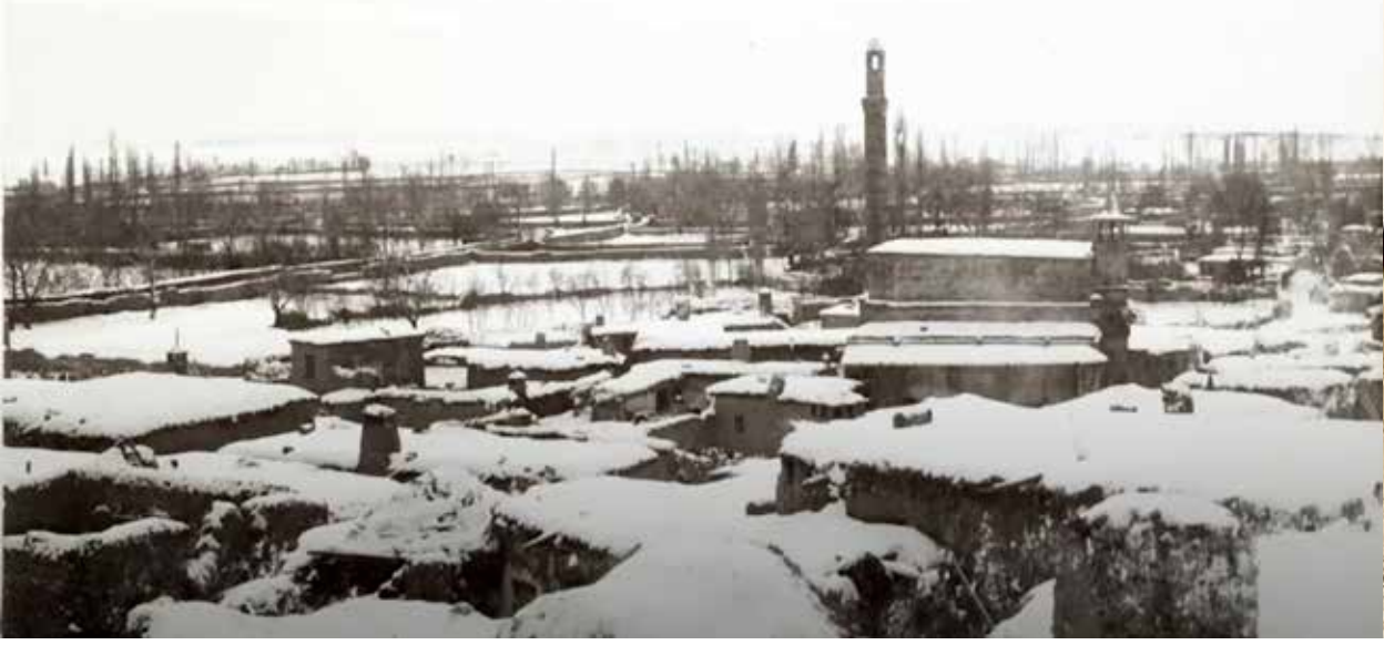
10/8/65d K 421 Kaleden genel görünüm

kadar da olsa bulunuyordu. Gödet Barajı'nın yapıldığı 1990'lara kadar Zeyve, Çeltik, Karadeğirmen, Boklubent, Emekseven ve Kale civarındaki bu meyve bahçeleri varlıklarını korudular.