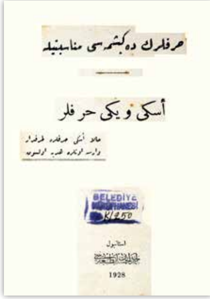
Azmi Bey'in kitabı, Eski ve Yeni Harfler 1928