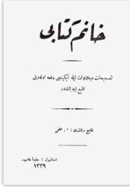
Azmi Bey'in Hanım kitabı

ay boyunca İstanbul Beyoğlu'nda bulunan Taşkışla'da hapis yatmış ancak suçsuz olduğu anlaşılınca hem kendisi hem de onu şikâyet eden öğretmen hakkında tayin kararı çıkarılmıştır.