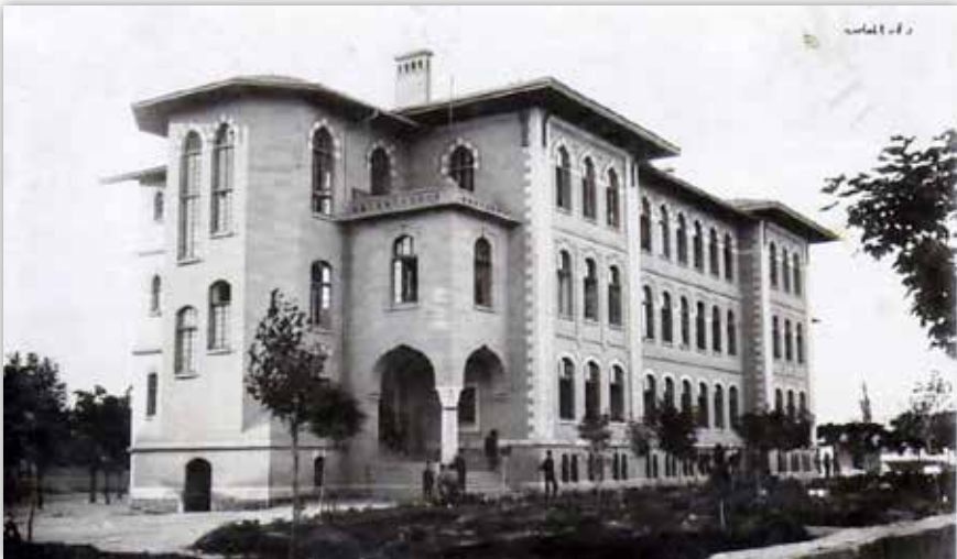
Erkek Öğretmen Lisesi, 1927

Şapka Kanunu yeni çıkmıştı. Atatürk'ün Konya'ya gelişini Muallim Mektebi öğrencileri yeni kasketleri ile istasyonda karşıladılar. Evinin önünde yapılan geçit törenine