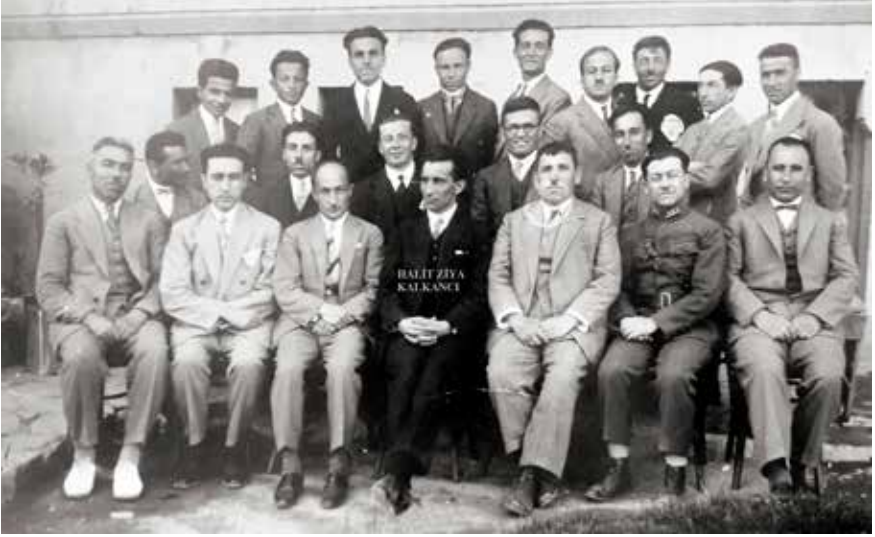
Halit Ziya Kalkancı, 1928

yalnız okuma-yazma öğretilmiyor, bundan ayrı hayati bilgiler de öğretiliyordu. Ayrıca subaylar için edebiyat, matematik, fenni terbiye (çağdaş eğitim) kursları da açılır Halit Ziya yönetiminde.