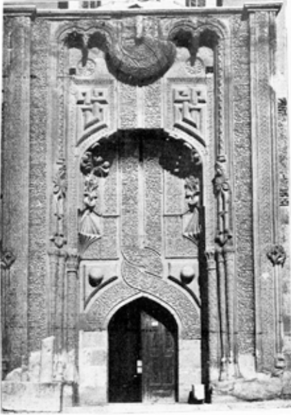
قرینه ایچمه مناره مردس سنک مزیه عرضل جهرسی

Konya daha birçok zaman asarı nefise-yi İslamiye için bir memba kalacaktır. Konya'yı bir kere gören her zevki selim sahibi zaten bunu tas-