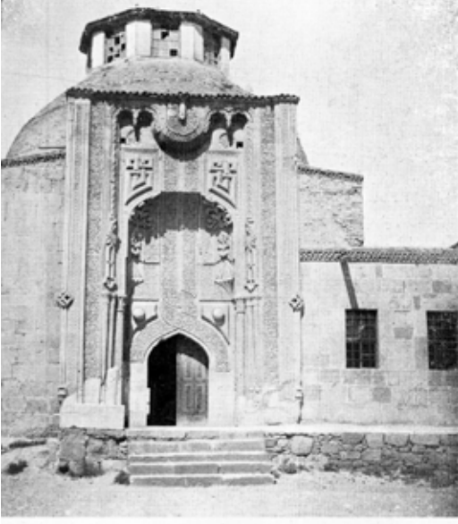
پر نقش و نگار بر قاپی