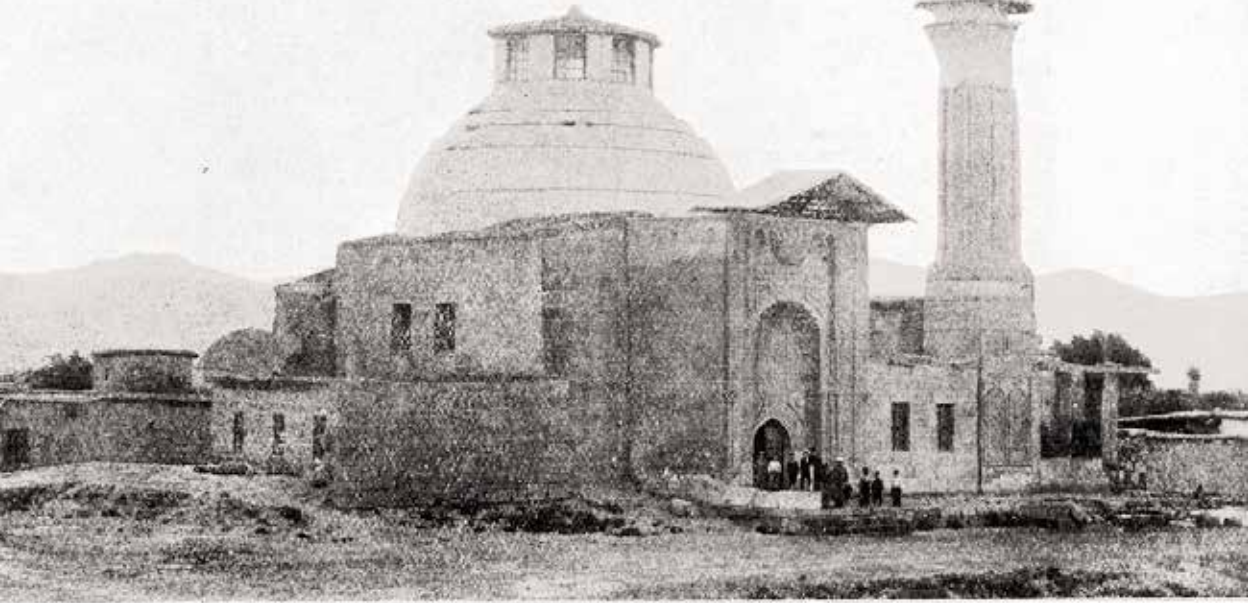
قرنیه دره صاحب عطا نك ارقاندره ایلچی مناره مدرسه

oldu. Bu medresenin medhal-i cephesi mermer olmayıp sarımtırak bir taştan masnu ve güne gün yazı ve nakışlar ile müzeyyendir. Dikkatle bakılınca güya yazılı iki şerit ve solundan yukarıya doğru suud ederek (yükselerek) ortada bir kere katlanır ve yan yana aşağıya doğru inip ka-