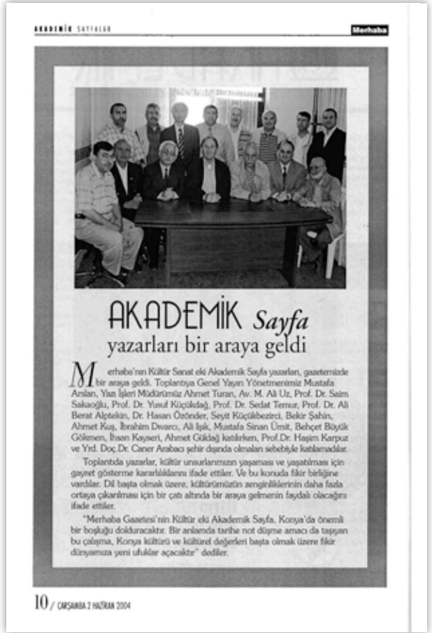
Akademik Sayfalar'ın İlk Yazarları

- Hocam, başkanları olduğum Yeşilay derneğinin ve Aydınlar Oca-