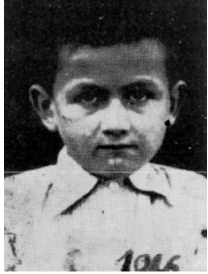
Okula başladığı yıl (Eylül 1946)

Biz Konyalıların ilgisini çekeceğine inandığımız bir bilgiyi de yeri gelmişken iletmek isteriz. Yeni Meram Yolu üzerinde Lastik Durağı adıyla