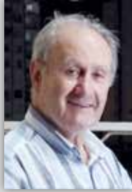
Prof. Dr. Saim SAKAOĞLU

Yirmi yaşımdan sonra tam 29 yıl sürecek bir gurbet hayatım olacaktır. İstanbul'da üniversite öğrenciliği (1959 Ekim-1965 Mart), Tokat'ta lise edebiyat öğretmenliği (1965 Nisan-1967 Eylül ve Atatürk Üniversitesi'nde öğretim elemanlığı (Ekim 1967-Eylül 1988). Ve Eylül 1988'den sonra Konya'ya dönüş. Artık yazıp çizmelerimizin ağırlık merkezi Konya olacaktı, oldu da. Tamamlanmasına kısa bir sürenin kaldığı seksen üçüncü yaşımı yeni bir hamle ile tekrar Konya ağırlıklı olarak yaşamaya başlıyorum. Ve sayfayı aralıyorum.