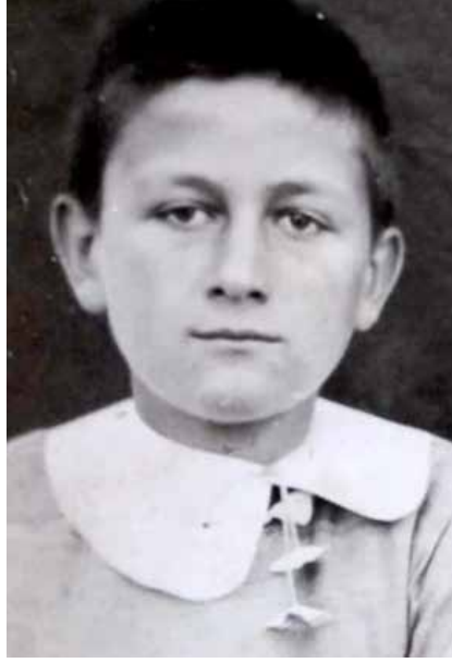
Şehadetnamemizdeki Vesikalık Fotoğraf: 1951

Bir gün satış için getirilenler arasında o muşamba da varmış. Bizimkiler bunu görünce artırmaya katılarak benim giymem için satın almışlar. Birkaç yıl, boyumun iyiden iyiye uzamasına kadar her kış mevsiminde bu muşambayı giydim. Dikkat edilirse kollar biraz uzun ve sol kolumda bir kıvrıma görülüyor. Kuşak ise