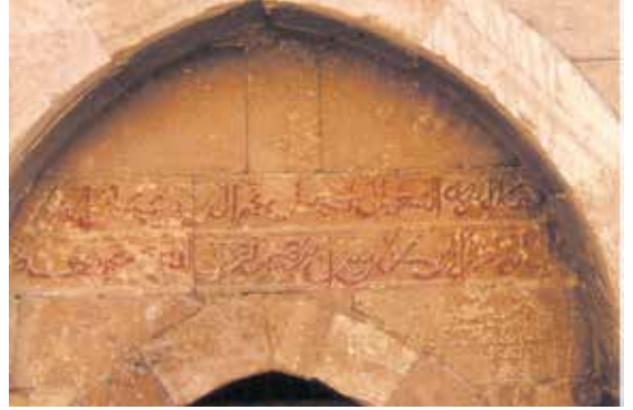
Karaaslan Türbesi kitabesi