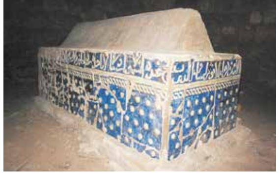
Karaaslan Türbesi içi