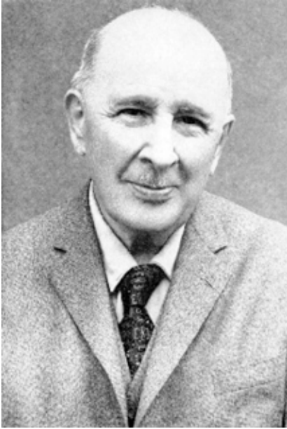
İsmail Hakkı Uzunçarşılı (1888-1977)

na/eşsiz köprü” olduğundan bahisle “Kemer Köprüsü” diye yâd eylediği Tokat Köprüsü Amasya tarafından şehre girerken Yeşilirmak üzerindedir. Köprü mükemmel ve muntazam olup kesme taş ile yapılmıştır. Beş gözü vardır. Köprü'nün üstünde şehre girerken sağına tesadüf eden kitabe, mermer taş üzerine hak edilmiştir. Yazının harici tesirlerden muhafazası için kitabe taşın iç tarafındadır. Köprü'nün tulu (uzunluğu) yüz elli bir, arzı (genişliği) yedi metredir. Kitabenin yazısı körfet Selçuklu sülüsüdür.