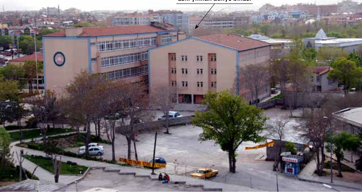
Eski yıkılan adliye binası

İkinci bilirkişi zimmet olmadığı yolunda rapor verince müvekkilim berat etti. Hatta müvekkil biraz da alacaklı çıktı.