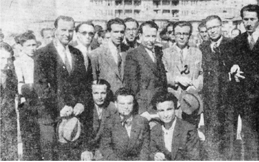
1944 Türkçülük davaları esnasında Ankara'da Nihal Atsız ile birlikte, önde ortada

yazılı ve sözlü imtihanları başarıyla vererek Ankara Gazi Terbiye Enstitüsünün Pedagoji bölümüne girdi.