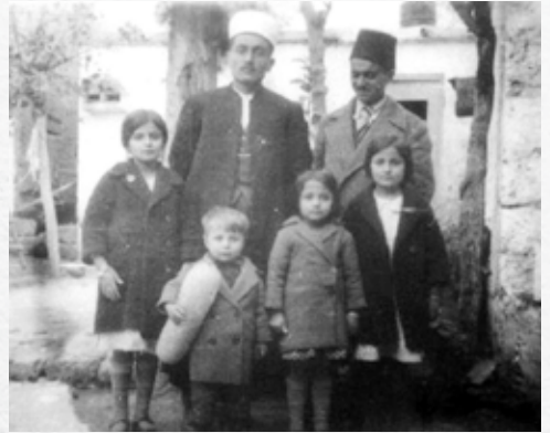
Zekai Efendi ve çocukları

Açıklama: Güfte, Bitlisli Şeyh Müştak Efendi (1759-1832)'ye aittir.