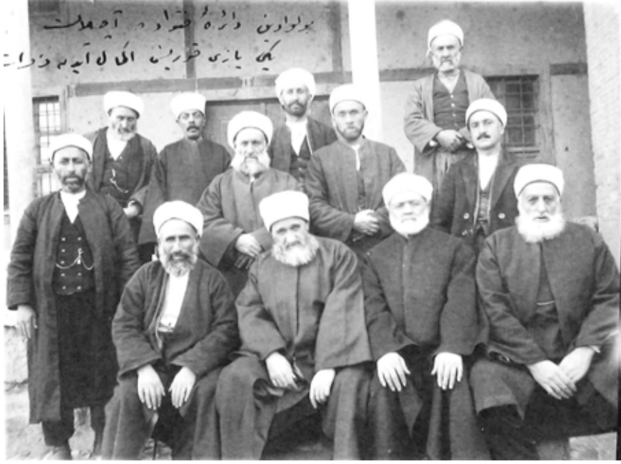
1927'de Yörükzade ve Bolvadinli alimler.