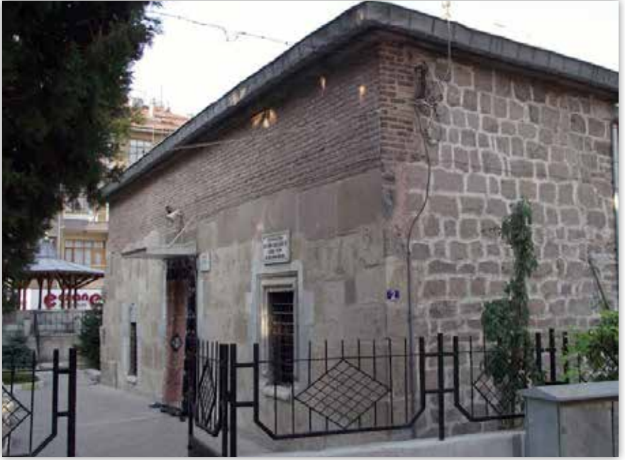
Beyhekim Mescidi'nin bugünkü hali

Konya'ya dair yazılan arkeolojik asardan (eserlerden) okuyabildiklerimden böyle bir kayda tesadüf etmedim.