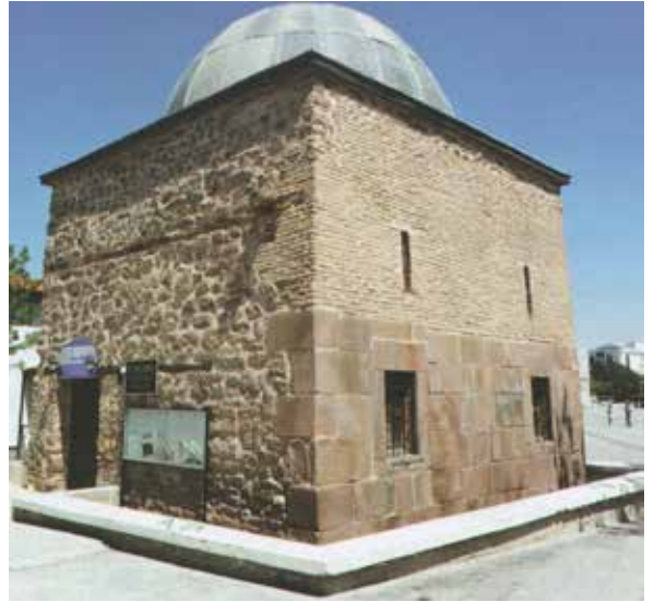
Sakahane Şifahane Mescidi.

Güzel olmasına, temizliğine dikkat ve gayret sarfettikleri payitahtlarının hastahanesi var mıydı, varsa neredeydi?