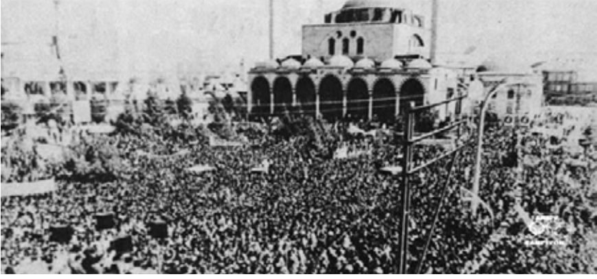
1977 yılında Alparslan Türkeş ve Necip Fazıl'ında katıldığı MHP'nin muhteşem Konya mitingi.

gece hiç uyuyamadım” deyince: “Rahatsız mıydınız?” diye sormuştum. Meğer onun uykusunu kaçırın şey doğuda PKK'nın ilk yaptığı olaymış. Sonra Alparslan Bey: “Bu olaylar devam edecek, önlenemeyecek, çok kan dökülecek” izahında bulunmuştu. Bu konuşmanın olduğu yıl yanlış hatırlamıyorsam 1983 veya 1984 yılı idi. Terör olayları hâlâ önlenemedi, çok kan döktü, çok şehit verdik, hâlâ dökülmeye de devam ediyor. Devletin, onu haksız yere tutuklamasına rağmen o, devleti ve milleti düşünüyordu. Onun bu ileri görüşlülüğünü ve vatanseverliğini bu konuşmamızdan sonra üşenmemiş bir A4 kâğıdı getirip bazı şekiller çizmişti. Uzun uzun da vatanın birliği ve bütünlüğü için alınması gereken tedbirleri anlatmıştı.