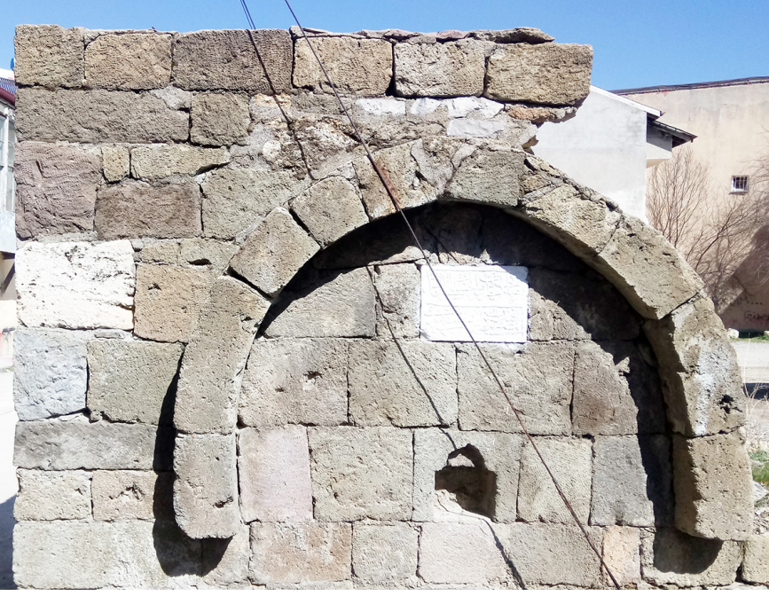
Mustafa Efendi Çeşmesi

Yarım daire kemer formulu çeşmenin ön cephesinde kemer ayaklara oturmaz. Cephe düz bir duvar şeklinde örülerek üzerine kemer yerleştirilmiştir. Yapının bugün sadece taşıdığı mevcuttur. Lüleleri bulunmamaktadır. Çeşmenin yalağı ve sekisi mevcut değildir.