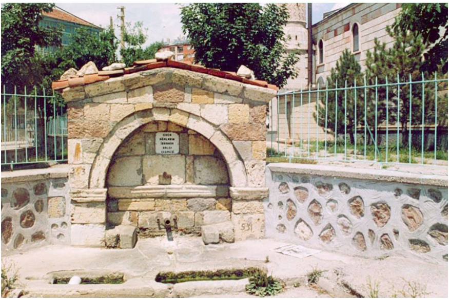
Koca Ağaların Çeşmesi

Çeşmesi, bağımlı, tek cepheli, kesme taş örülü sokak çeşmesidir. Çeşmenin sağ tarafından camiye çıkan merdivenler yapıldığı için sağ köşe taşları eksiktir. Günümüzde çeşme kullanılmaya devam etmektedir.