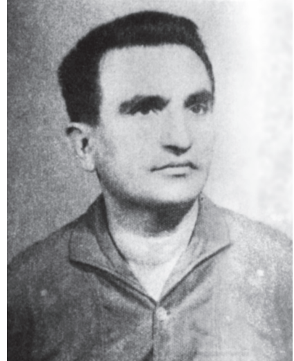
Osman Yüksel Serdengeçti (1917 - 1983)

O zamanlar partideki ruh çok farklı, birlik çok kuvvetli idi. Türkiye'de sağ ve muhafazakâr bir partiye ihtiyaç vardı. MHP bu ihtiyaca cevap vermeye çalışıyordu. Bu ruh içerisinde günümüzde partinin ikiye bölünmesini anlamak mümkün değil.