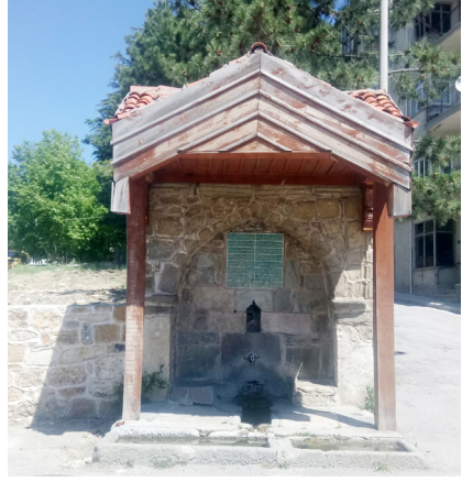
Derviş Ali Ağa Çeşmesi

Seydişehir Âyanından Derviş Ali Ağa tarafından H.1249 / M.1833-1834 yılında yaptırılmıştır. Envanter numarası: KVE-TR-42.25.05 Seyyid Harun Mahallesi'nde, Seyyid Harun Camisi'nin güneyinde yer almaktadır. Seydişehir kenti'nin giriş kapısından Ulukapı yanında yontu taştan inşa edilmiş meydan çeşmesidir (2) . Taşların araları beto-