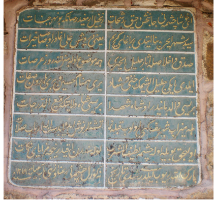
Derviş Ali Ağa Çeşmesinin Kitabesi H.1249

narme harçla derzlenmiştir. Çeşme ,3.27 m. genişliğinde, 3.43 m. yüksekliğinde, 1.20 m. derinliğindedir. Sivri kemeri iki taş ayağa oturur. Ayaklarda üzengi seviyesinde de silme yer alır. Kemerin altındaki aynalıkta, mermer üzerine talik yazı ile yazılmış on altı satırlık kitabesi vardır. Kitabenin yazıldığı bu bölüm zemini yeşil renktedir, yazılar ise altın yaldız rengindedir. Kitabenin altında tas koymak için yapılan taslık nişi ve lülesi mevcuttur. Taslık nişi sivri kemerlidir ve küçüktür. Çeşmenin önüne sonra-