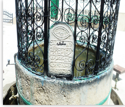
Memiş Efendi Türbesi Şadırvanı

19. yüzyıl sonunda yapıldığı tahmin edilen çeşme Çavuş Mahallesi Atatürk Caddesi’nde Memiş Efendi Cami’nin doğusundadır. Memiş Efendi Cami’sinin avlu duvarına bitişik olarak, kesme taştan inşa edilmiştir. Tek cepmeli, yarım daire kemer form-