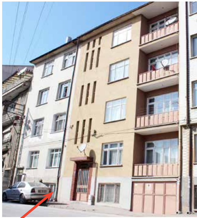
Ahmet Fakih Türbesi'nin olduğu yer.

Şimdi gelelim Ahmet Fakih Türbesi'nin yerinin nasıl tespit edildiğine. Konya Mahallelerini yazarken bizi ilgilendiren en önemli meselelerden birisi de mahallerin isimlerinin nereden geldiği meselesidir. Konya'da bir Hoca Ahmet Fakih Mahallesi var. Mahalle'nin neden bu isimle anıldığının sebebi bellidir. Fakat Köprübaşı Caddesi üzerinde yer alan Ahmet Fakih Mahallesi'nin adı nereden geliyordu. Tapu Kadastro kayıtlarını incelerken cadde üzerinde bugünkü Sücaettin Camii'nin batısında bir apartmanın altında Ahmet Fakih Türbesi yerine rastladık. Konunun araştırılmasını derinleştirdik. Mahallinde de araştırmalar yaptık. Bahsettiğimiz Camii'nin batı köşesinde yan yana inşa edilmiş beşer katlı üç ev var. Ahmet Fakih Türbesi bu üç evin ortasındaki evin altında bulunuyordu. Bu türbe Konya'daki diğer tarihi türbelerle birlik-