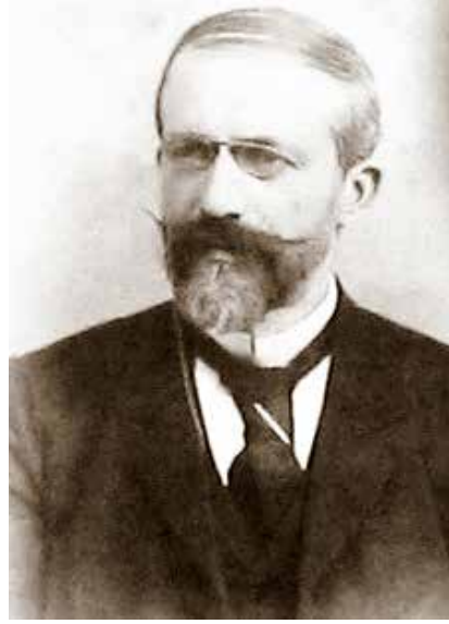
Ebuzziya Tevfik (1849-1913)