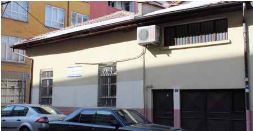
Ahmet Fakih Cami

Yan yana bulunan iki arsa müteahhide verilmiş. Sonradan bu zat ile de görüştüm. Bu zat ortadaki arsaya vakıf var diye inşaat yapmamış. Yetmişli yıllarda bu arsanın sahibi olan kadın türbeyi yıkmış. Ahmet Fakih'in kemiklerini götürüp Üçler Kabristanı'nın bir yerine gömmüş. Bundan sonra kadın arsayı başka bir müteahhide verip türbe üzerine beş katlı bir bina yaptırmış. Olay 1970'li yıllarda cereyan ettiği için durumu başka bilenlere de rastladım.