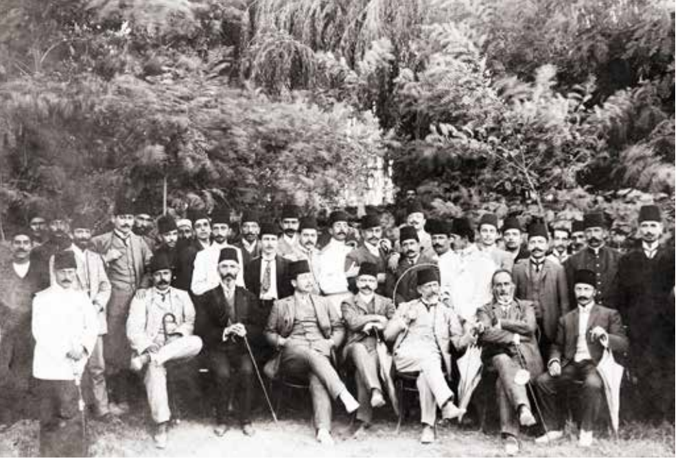
Ebuzziya Efendi, Konya'da sürgünde iken

da hastaneye yatırıyorlar. Muhibbimizin arkadaşı olan tabip, çocuğu usulü fenniye dahilinde tedavi eder. 15 gün zarfında çocuk iyileşir. Ve vakayı hem tabibe hem de muhibbimize anlatır.