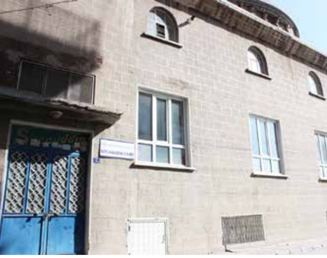
Sücaettin Camii (Sücazade Mescidi)

Yukarıda bahsettiğim gibi Konya'da tarihi Osmanlı ve Selçuklu Türbeleri ile birlikte satılırken bu türbe de satılmış. Bu türbeler teker teker belediyeler tarafından istimlak edilip etrafları açılırken Ahmet Fakih Türbesi yok olmaktan kurtulamamış.