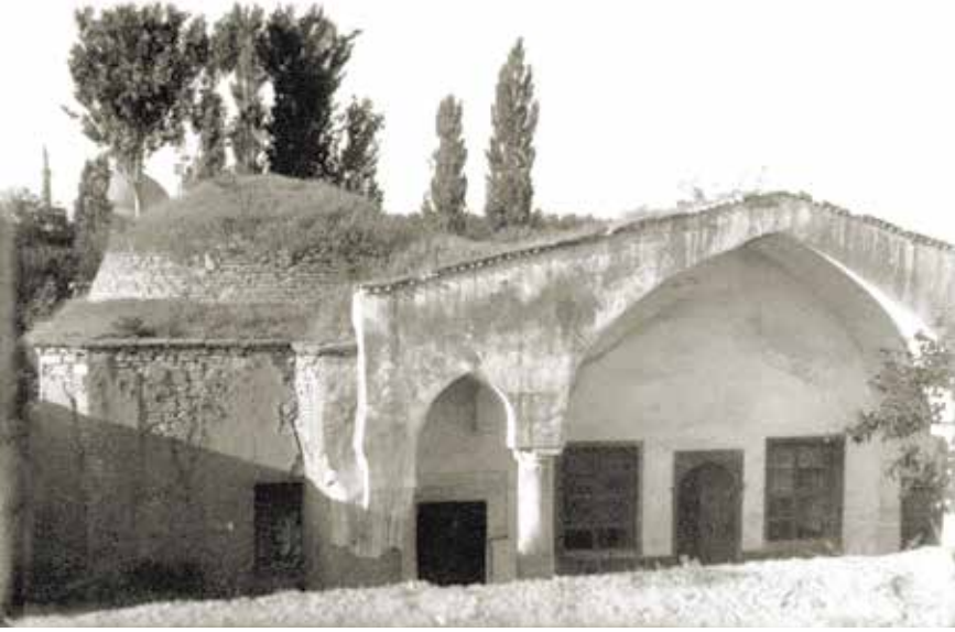
Mahmuđiye / Ali Gav Medresesi

ma) suretinde bir ihanete nisbet ediyor.