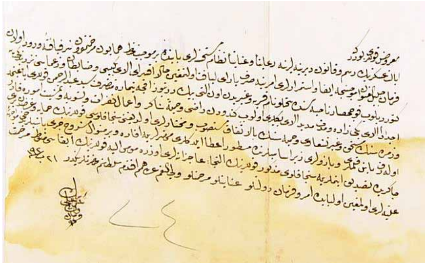
Koçbekir Ağa'nın Niğde alaybeyliğine tayinine dair belge-1