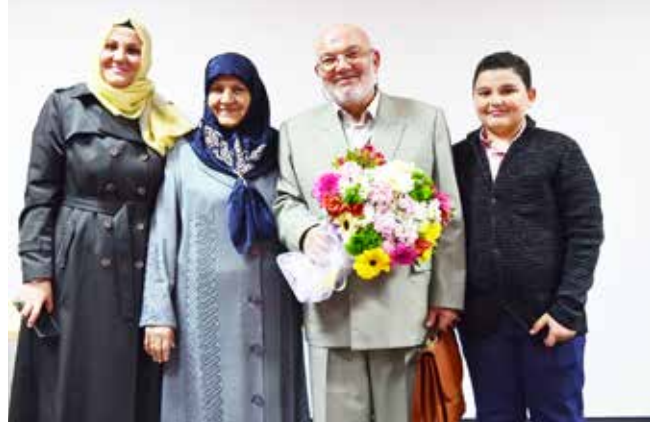
Aydınlara Ocağı'nın düzenlediği 65. Yaş Günü'mde kızım, hanımım ve torunumla

Baba bayram sabahıdır. O sabahlarda uyanmak temennisiyle ellerinden öpüyorum.