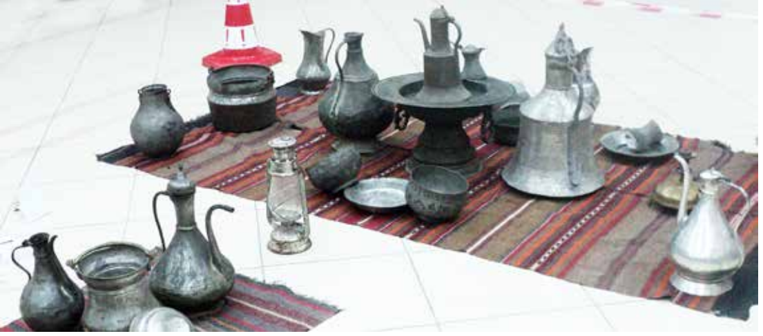
Seydişehir 19.yüzyıla ait mutfak eşyaları