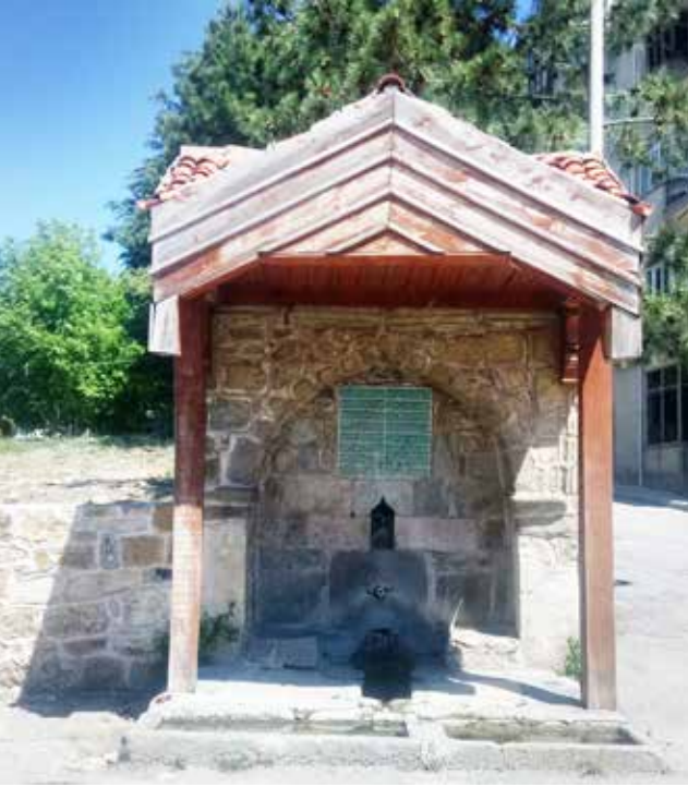
Derviş Ali Ağa Çeşmesi