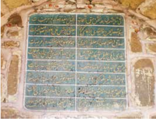
Ayan Derviş Ali Ağa Çeşmesi Kitabesi H.1249

10857, 11024, 21881, Beğşehri 7812, 16901, 17074, 33175, Seydişehir 3798, 8010, 8804, 16814, Bozkır 7843, 19298, 18505, 37803, Karaman 6337, 14621, 15112, 29733, Hadim 2710, 5557, 6072, 11629, Ereğli 4974, 10895, 11260, 22155, Karapınar 2968, 6889, 7037, 13926, Esbkeşan 4253, 9487, 10338, 19825, Yekûn 71643, 167321, 170177, 337499.