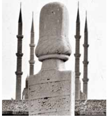
Edirne Muradiye Mevlevihanesi haziresinde bir melevi kûlahlı şahide