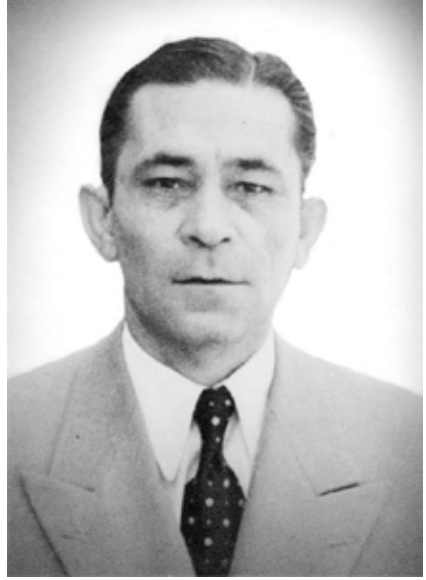
Cahit Sıtkı Tarancı (1910-1956)

“Tarancı'nın ölümünün 47. gününde, 5 C sınıfı olarak bir Ta-