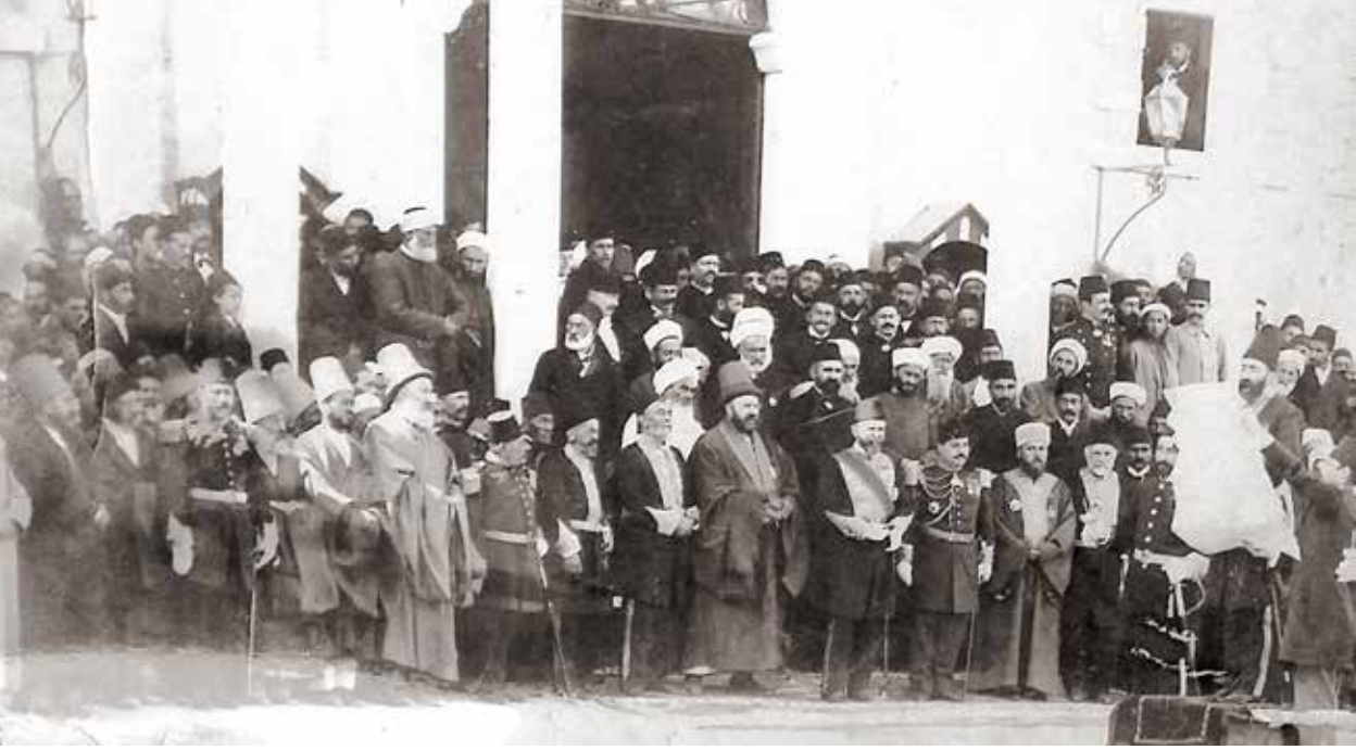
Konya Valisi Mehmet Ferid Paşa ve Mevleviler

da taraf-ı daiyânemden tab' ve neşr ettirilecektir. Bazı zevât-ı muhteremenin bu tarzda söyledikleri şiirlerden birer beytini takdim ediyorum. Bunlar beş beyitten on sekiz beyite kadardır. Bu revî ve redif üzere ihdâ buyuracak olan zevât-ı kirâmın doğ-