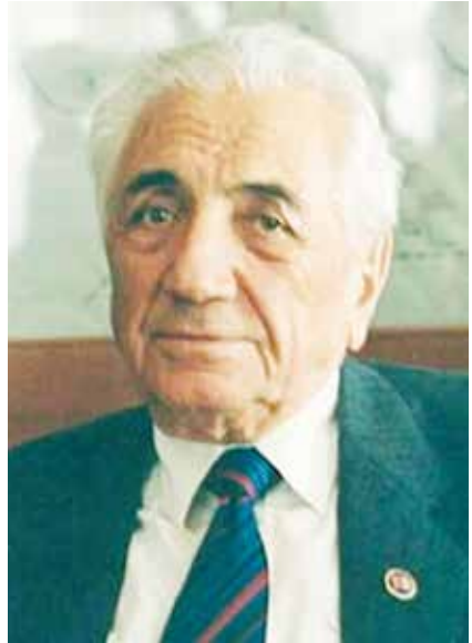
Mahmut Cahit Külebi (1917-1997)