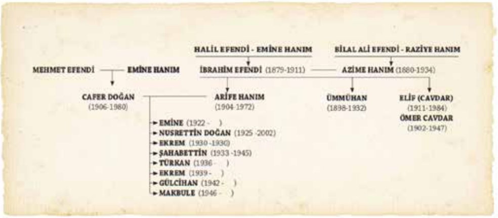
Soy Ağacı 3: İbrahimzade Örkenez (Bağkonak) Kolu

Çocuk, yaşlı, kadın demeden acımasızca gerçekleşen katliamın sağ kalabilen şahitlerinin ifadeleri kayıtlara geçirilmiştir.