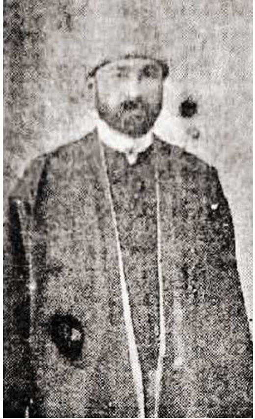
Mehmet Nureddin Efendi

Şeyh Nureddin Efendi ilanında şöyle demektedir: “Bazı udebâ ve muhibbân-ı tarikat taraflarından “na” harf “revisi” ve “ Külâh-ı Mevlevî ” redifi ile nazm edilen eş’âr “ Külâh-ı Mevlevî ” serlevhası altın-