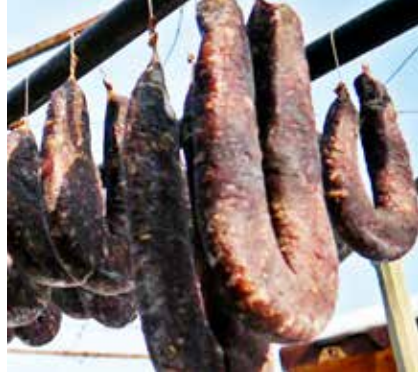
Eskileri hatırlatan bir irişki.

Hazırlıklar tamamlandıncaya bu et bağırsaklara doldurulurdu. Ancak önceleri hazır bağırsaklar bulunma-