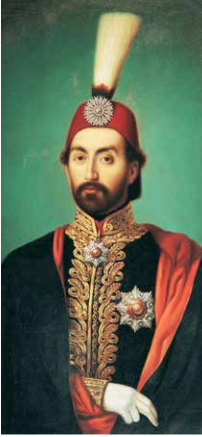
Sultan Abdülmecit (1823-1861)

rihinde Sultan Abdülmecit (1823-1861) tarafından kurulan Postahane-i Amire önemli bir dönüm noktası oldu. Bu büyük postanenin yapılışına kadar posta taşımacılığı daha dar olanaklarla da olsa yine de yürütülüyordu. Geleşigüzel binalarda toplanan postaların hayvanlarla gidecekleri yerlere taşınması için çabalanmaktaydı. Sultan II. Mahmut (1785-1839)dönemine kadar haberleşme yalnızca devlet eliyle yapılıyordu. Bu görevi yerine getirmek için "sai, ulak, tatar, çapar, berid" denilen görevliler kullanılıyordu. Sultanın genç yaşta ölümünden sonra, onun zamanında başlayan posta taşımacılığındaki yenilikçi hareket, oğlu Sultan Abdülmecit zamanında ele alınmıştı (3) .