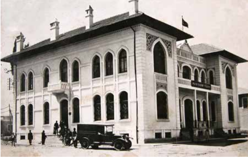
1925 yılında inşasına başlanan Konya Posta (PTT) Baş Müdürlüğü binası, Kayalı Park.

civarında büyük bir hezimete uğrattığı zaman bu zafer haberini müjdelemişlerdi. Esasen Selçuklular zamanında muntazam olan posta teşkilatı Selçuklu devletiyle beraber Osmanlı Devleti'nin eline geçti.