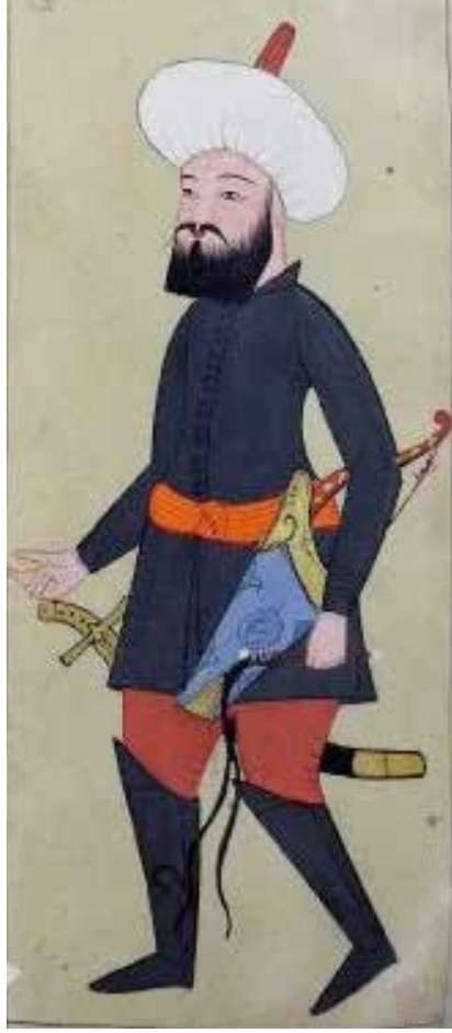
Hans Sloan's Album, "The Habits of the Grand Signor's Court", British Museum.

Yüzyıllar boyunca dev bir imparatorluğu yöneten Türkler, haberleşmeyi ekonomik, teknolojik ve sosyal kalkınmanın önemli bir alt yapısı olarak görmüşler o çağlarda komşularında bir benzeri