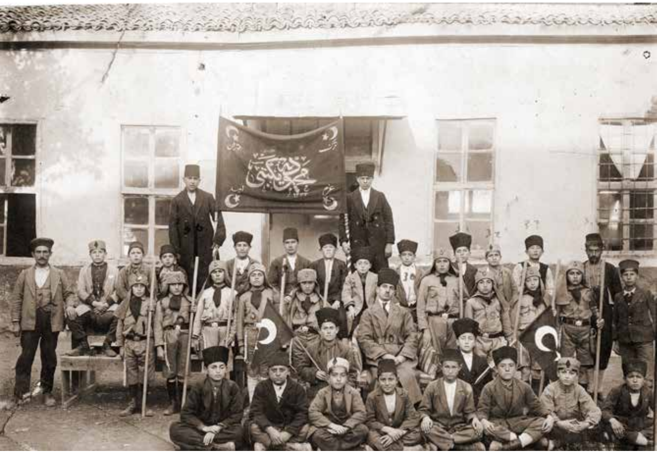
Mahmudiye (Altınçeşme) İlkmektebi, 1924 (H. 1340)