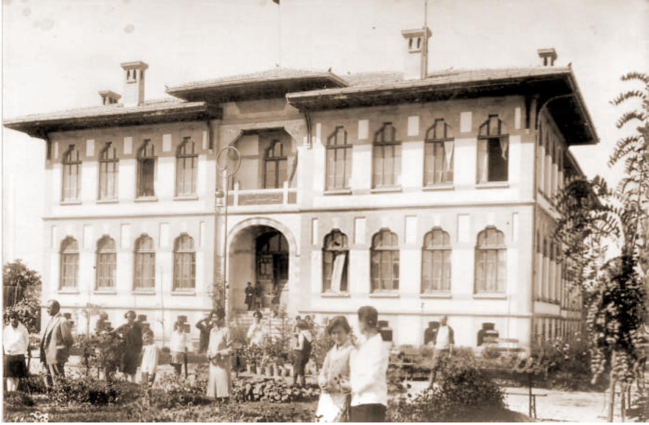
Konya Dar'ül-Muallimin Kız Mektebi.

olan mektebin 70 öğrencisi vardır. 218 mezun vermiştir. Darulmuallimin'den mezun 3 öğretmeni vardır. Geliri hazinedendir. 7.200 kuruş gelir, 300 kuruş masrafı vardır.