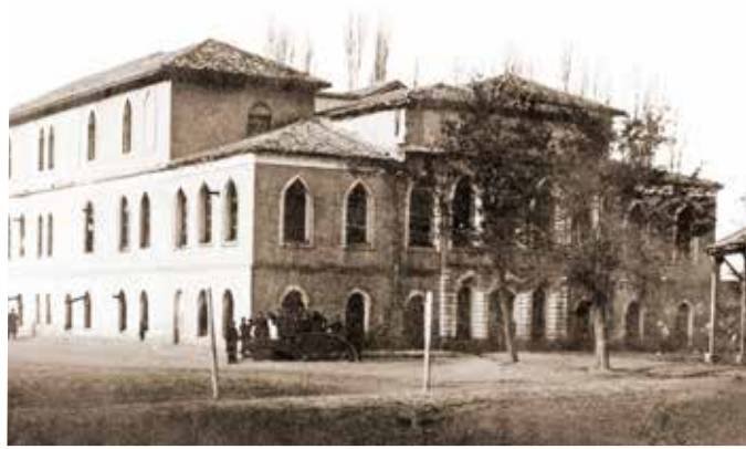
Konya İdadisi (Bugünkü Karma Ortaokulu)

Bu özel sayıların hazırlık aşamasında da Konyalı ailelerin aile albümlerinden de istifade ettik. Özel sayıların yayımlanması ile okuyucularımızdan gelecek katkılarla, aile albümlerinde bu okullara ilişkin tespit edilecek fotoğraf, diploma ve derlenecek hatıraların da gelecek sayılarımızı zenginleştireceğimi temenni ediyoruz.