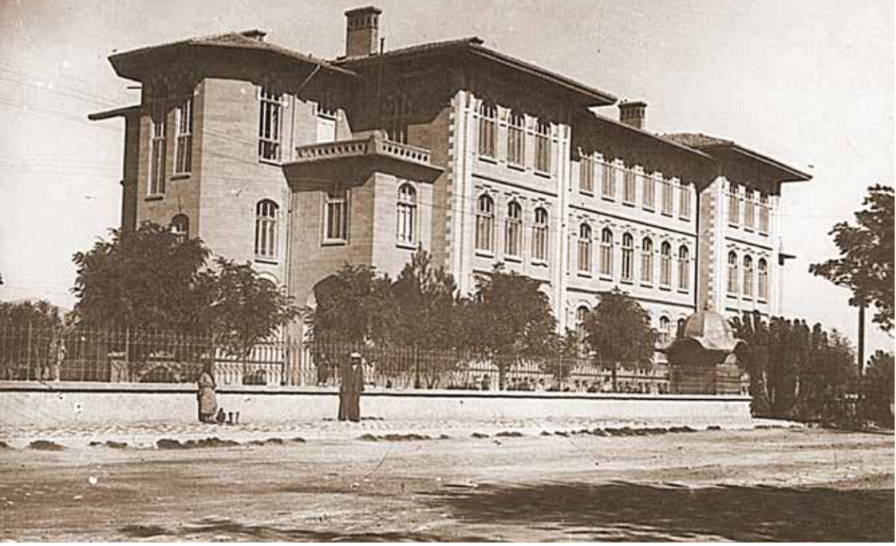
Konya İdadisi (1889-1913) ve Konya Sultanisi (1913-1923) olarak kullanılan Tarihi Bina.