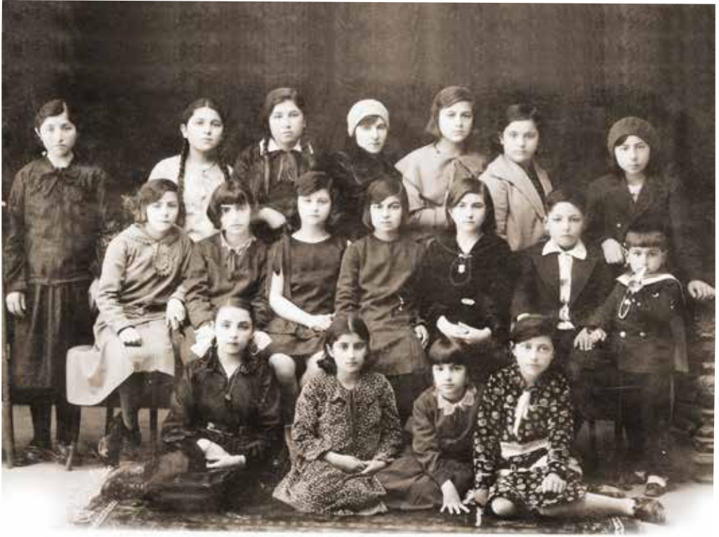
1929 yılında alınan üç erkek öğrenci ile karma eğitime geçen, Konya Çukur (Akçeşme Kız) Mektep Muallim ve Talebeleri, 1931.