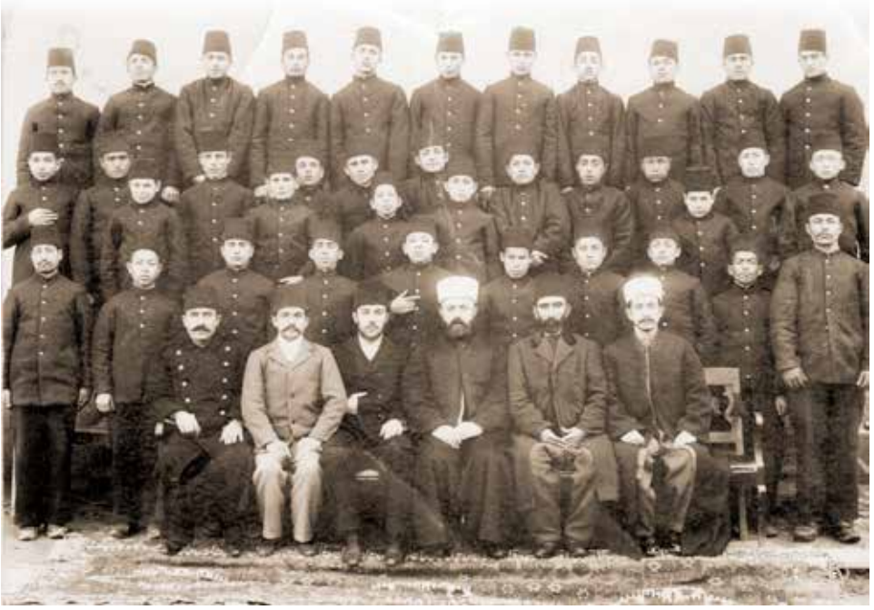
Konya İdadisi Heyet-i Talimiyesi ve Talebeleri Diploma Merasimi, 1900.