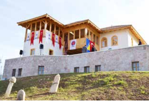
Selçuklu Belediyesi ve TİKA tarafından yeniden inşa edilen Saraybosna Mevlevihanesi.