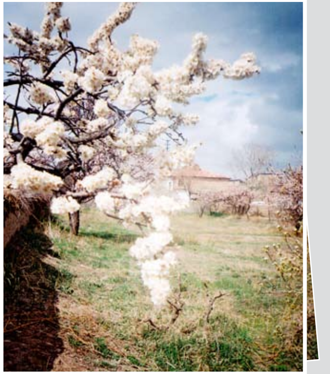
Bu, çiçekleriyle kâh el uzatan, kâh yere temenna eden şeker armudu da yok artık. Çiçeğin yaydığı nefis kokuyu bir daha nerede yakalayabileceğiz acaba? Ben ona 'Cennet Kokusu' derdim, öyleydi de... O kokuyu bilmeyenlere onu anlatamazsınız ki... (3 Nisan 2005)