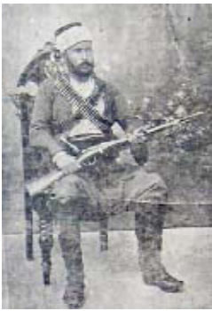
Aziz Efendi'nin, Ebüzziya Tevfik'i kaçırmak istediği günlerde çekilmiş bir fotoğrafı ( Yeni Anadolu , 30 Kanunuevvel 1932)