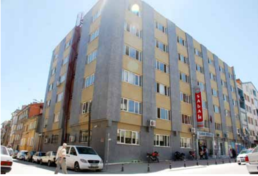
Mevlâna'nın evi ve medresesinin yerinde bulunan Sabah Dershanesi.

belki de tiftikten zarar ettikten sonra satmış olabilir.