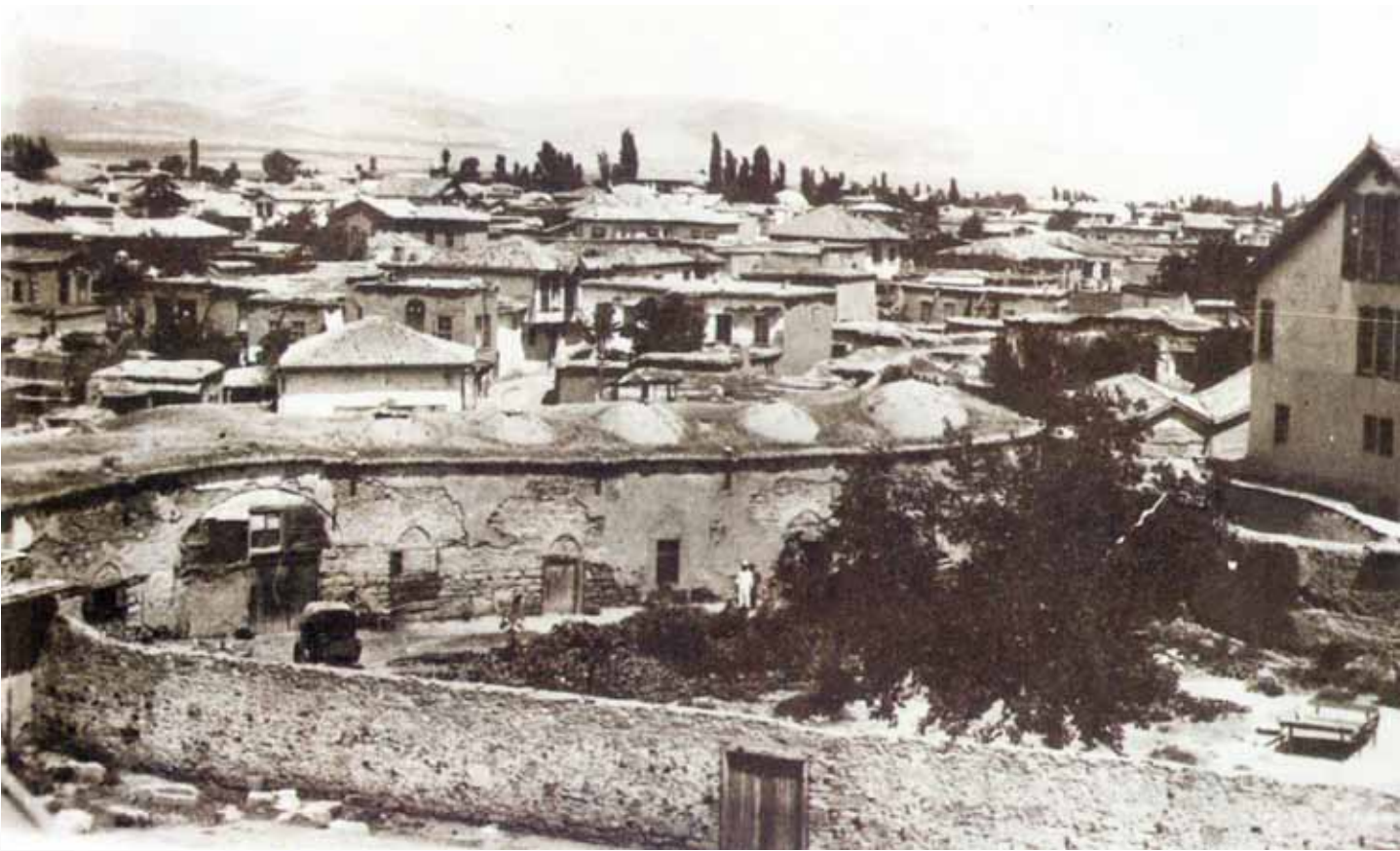
Türbe bitişiginde Sultan Selim İmanereti