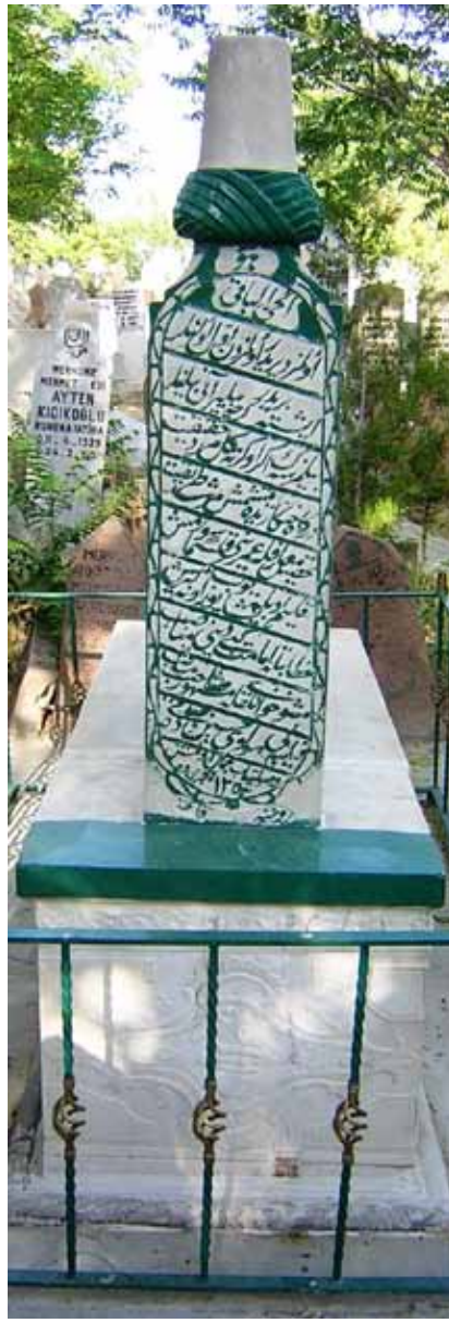
Hüseyin Sıdkı Dede'nin Üçler Mezarlığı'ndaki kabri.

Zaviyenin duvarla çevrili küçük bir bahçesi vardır. Bugünkü türbe-