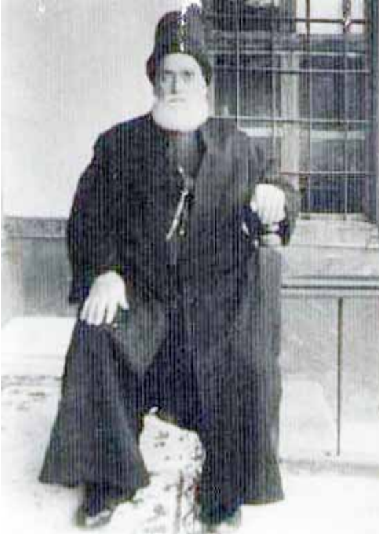
Hüseyin Sıdkı Dede

el-Hayyü’l-Bâki Ölmez diridir ölmezden evvel ölenler İşte biridir gerçi bilir anı bilenler Bilmezsen eğer öğrene gel merd-i hakikat Dergâh-ı hünkârîde yetişmiş mürşid-i tarikat Tahsil-i maarifile ömrünü kısmen sürmüştü Tâlim-i edeble yaşayub yüz ona girmiş Hitâbetle imâmet gibi dinî menâsib Mesnevî-hanlıkla şühûr-ı sâhib-i münâsib Filibeli Mevlevî Hüseyin Sıdkî Dede Vuslat-yâb-ı cemâl olmuş 1352 hicride