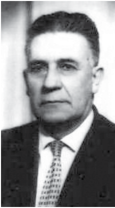
Hattat Ahmet Ferid Ülgen

Ahmed Ferid Efendi'nin babası Hasan Kudsi Efendi, 1847 yılında Bozkır Hocaköy'de doğdu. Hasan Kudsi Efendi'nin Annesi Emine Hanım'dır. Hasan Kudsi Efendi ilköğrenimini ağabeyi Şeyh Muhammed Bahaeddin Efendi ve Konya Müftüsü Kadınhanılı Hüseyin Efendi'den yaptı. Hat sanatını Alaiyeli Abdulgani Vehbi Efendi'den öğrendi. Veli Sabri Uyar, Hasan Kudsi Efendi hakkında: "İlm-i tasavvufta ve fünün-ı âliyyede yekta ve bihemta idi. Fazl u irfanına nihayet yok idi. Zamanın kutbu idi. Abid ve zahid, mezinne-i kiramdan ve ulema-i amilinden ve sülehay-ı ümmetten ve erbab-ı keşif ve ehl-i hâlden bir zat nadiru'l-vucuddu" demektedir. Hasan Kudsi bir eğitimci olarak pek çok öğrenci yetiştirmiştir. Müderris olduktan sonra zahiri ve batini ilimlerle mücehhez olduğu halde inzivaya dayalı bir hayatı tercih etmiştir. Siyasetle ilgilenmemiştir. Ayrıca uzun yıllar Kapı Camii ve İplikçi Camii'nde vaziflik yaparak halkın takdir ve sevgisini kazanmıştır. Hasan Kudsi Efendi, Ebu Bekir Sami Paşa Dairesi (Islah-ı Medaris)'nde müderrislik yapmış ve burada pek çok öğrenci yetiştirmiştir.