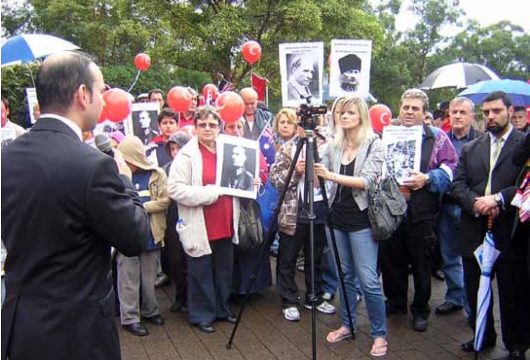
Asurî (Süryani) Soykırımını Protesto

saat 13.00 sularıydı. Sydney’de parlamento binasının bahçesine yerleştirilen sözde Ermeni soykırımı anıtının ezikliği henüz zihinlerde küllenmemişken Fairfield Belediye Meclisinin de Süryanilerin Asurî soykırımı anıtı yapma isteklerini kabul etmesi üzerine duyarlı bir grup Türk, aileleriyle birlikte bu protestoya katılmışlardı. Ancak, katılım tahminlerimin çok ötesinde oldukça azdı. Sydney’deki bir grup Ülkücü’nün düşüncesinin eseri olduğu anlaşılan faaliyet, aynı zamanda bir organizasyon bozukluğunu yansıtıyordu. Oysa böyle önemli faaliyetler, bütün toplumu kucaklayan örgütlerin elbirliğiyle gerçekleştirilmeliydi. Yine de milli duygularını heyecanla yaşatan bir Türk grubu memleketten binlerce km uzakta görmek de hoştu doğrusu.