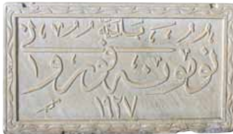
Fenni Fırın'ın kitabesi