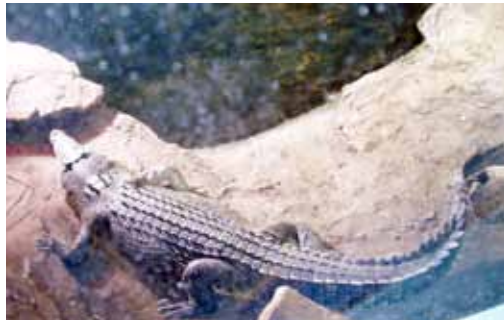
Sydney Akvaryumu'nda timsah