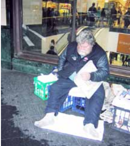
Sydney şehir merkezinde bir “evsiz”