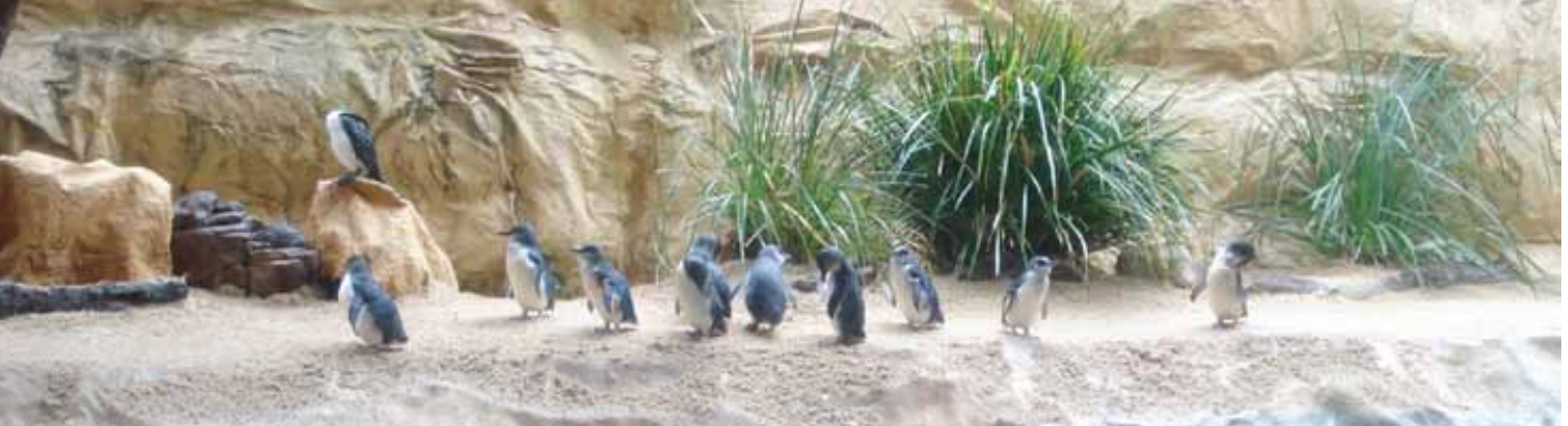
Sydney Akvaryum'da penguenler

Akvaryum'un ünlü krokodiline hazırlanan kayalıklar içerisindeki küçük göl, tabii ortamına uydurulmuş. Camdan görülen kesiti itibarıyla iki metre kadar derinlikteki gölünün kayalık tabanında yaşlı bir koca ağaç kütüğü gibi hareketsiz yatan bu koca timsahın boyu yedi sekiz metre var. Kocaman ağzının dışına taşmış kimi birbirine paralel, kimi çapraz dişlere yakalanan bir nesnenin kendisini kurtarması olası değil. Seyircileri ne kadar taşkınlık yaptıysa da onu suyu buğulanan gölünün dışına bırakın çıkartmayı, en ufak bir yaşama emaresi gösteremediler.