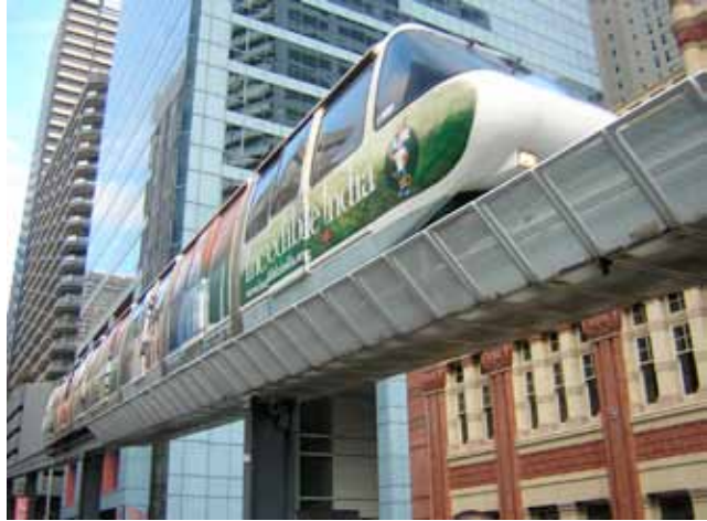
Sydney’de hava treni