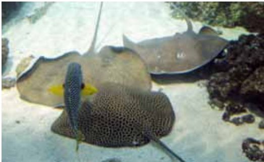
Sydney Akvaryumu'nda vatozlar