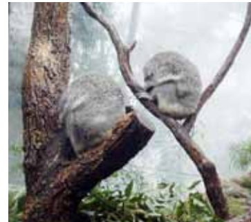
Sydney Akvaryumu'nda koalalar