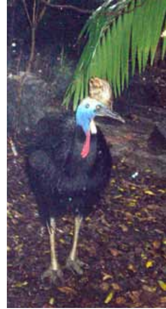
Sydney Akvaryumu'nda dünyanın en tehlikeli kuşu Cassowary.

Akvaryum'un önündeki kordona göre bizi City içlerine ulaştıracak yol oldukça yüksekte. Bunun için kimimiz asansörle kimimiz de yürüyen merdivenle caddeye çıkıyoruz. Bu esnada başımızın üstünden geçiveren hava trenine de tanık oluyoruz. Turistik amaçlı bu küçük ebatlı tren, City içi ile körfez arasında çalışıyormuş. Oldukça sessiz ve hızlı; ama ne yazık ki biz bunu deneye-meyeceğiz.