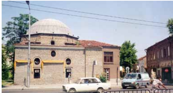
Bulgaristan'ın Filibe şehrindeki Taşköprü Camii. Halen gazino olarak kullanılmakta.