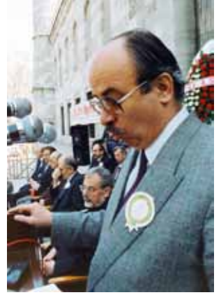
Sultan Ahmet Camii önünde kitap fuarının açılış konuşmasını yaparken.

Ş.K.: İzin verir misiniz, ben bir araya girebilir miyim? Batı