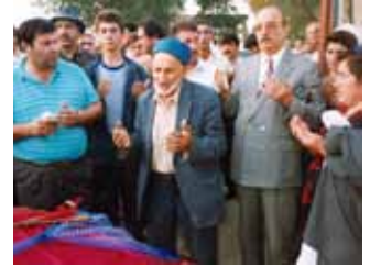
Bişkek yakınlarında Ahıska Türkleri'nin yaşadığı bir köyde, imam efendi gelin uğurlama duası yaparken.