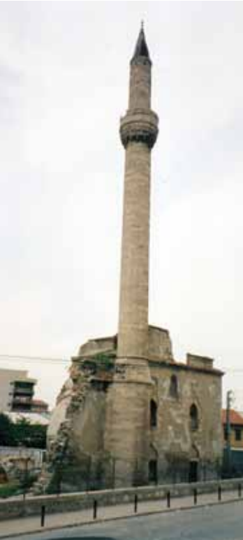
Üsküp Muslıhiddin Abdülğani Dükkanca Camii ve minarenin harap olmuş hali.