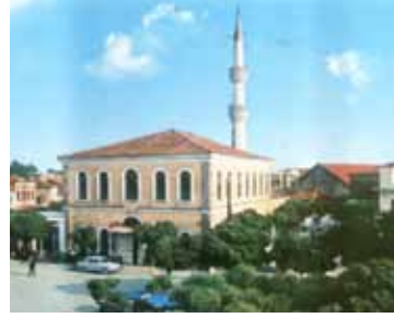
Gümülcine Merkez Camii.

Ş.K.:Burada izin verirseniz ufak bir sorum olacak: Yazı yazmak arzusunun içten gelmesi güzel bir şey. Acaba örnek aldığınız veya kendile-