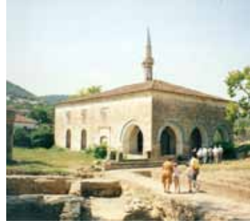
Romanya'nın Babadağ şehrindeki Gazi Ali Paşa Camii. Bu cami Türkiye Diyanet Vakfı tarafından restore ettirildi.