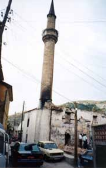
Makedonya Titoveles (Küprülü) Fazıl Ahmet Paşa Camii. 1994 Ramazanında yakılmış.