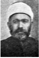
1908 Konya Mebusu Salim Efendi