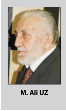
M. Ali UZ

Konya Valisi Burdurlu Tevfik Paşa zamanında Aziziye ve Kapı Camileri ile birlikte bütün Konya çarşısı yeniden inşa edilmeye başlandı. Büyük ve küçük bedestenlerle At-