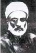
1908 Konya Mebusu Zeynel Abidin Efendi