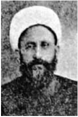
1908 Konya Mebusu Mehmet Vehbi Efendi