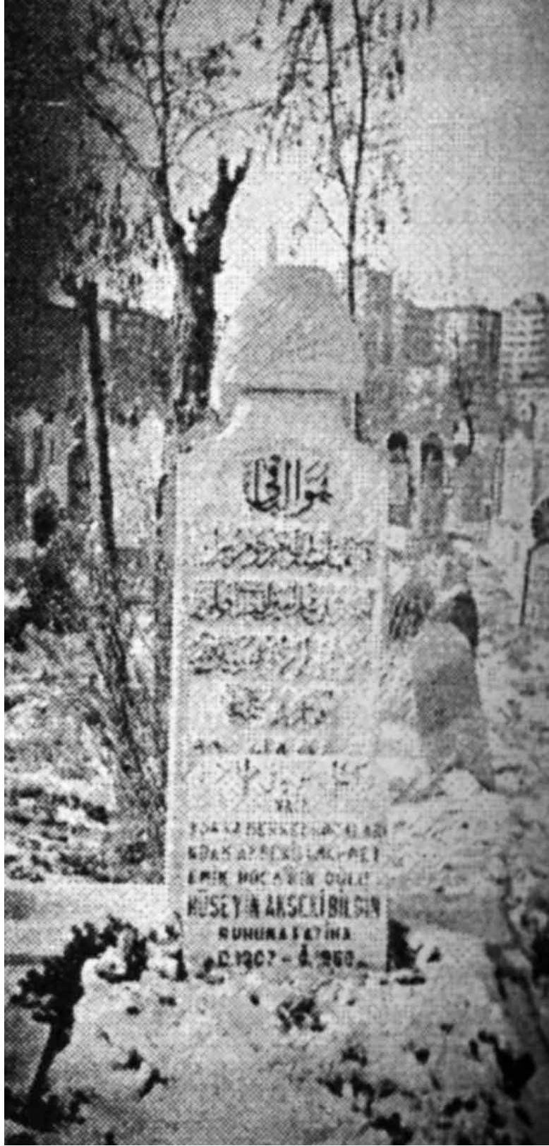
Hüseyin Feyzi Efendi'nin kabir taşı.