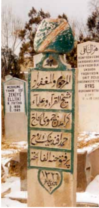
Büyük Çimili Hoca'nın kabir taşı.

değerli insanlara vefa borcumuz vardır. Bu anmalarla vefa borcumuzu ifa etmeye çalışıyoruz.