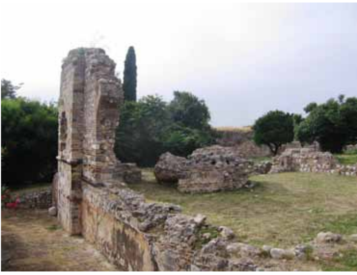
Patras Kaleiçi Camii