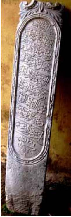
Osmanlı Mezarlığı "şefa'at ya rasulallah" ibareli mezar taşı.