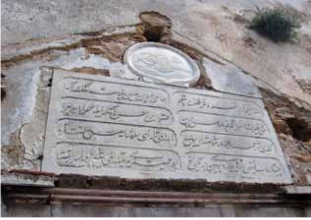
Sakız Adası Bayraklı Camii kitabesi.