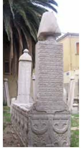
Sakız Adası Osmanlı Mezarlığı Ali Paşa'nın kabri.

Kaptan-ı Derya (Oramiral) Nasuhzâde Ali Paşa Arnavutluk bölgesinde yaşayan denizci bir babanın oğludur. Nasuhzâde Ali paşa, devrin Kaptan-ı Deryası Küçük Hüseyin Paşa (ö.1803) tarafından tersaneye kabul edilmiş, 1810 yılında donanma ümerası (kaptan) sınıfına terfi etmiş, 1812 yılında ise Kaptan-ı Hümayun payesiyle kalyon kaptanlığına getirilmiştir. Bir süre sonra bilinmeyen bir sebeple bu görevinden ayrılan Ali Paşa, denizcilikte şöhret sahibi olduğundan, aynı göreve padişahı II. Mahmud tarafından yeniden getirildi. 1814 yılında Rum korsanların faaliyetlerini basturmak üzere gönderildi. 1821'de, Rumların saldırıları Ege adalarına da sıçradı. Rum asilerin Sakız Adası'nı muhasara ettiler. Kaptan-ı Derya Ali Paşa donanmayla Sakız'a gelince Rum gemileri kaçıştılar. Kale de muhasaradan kurtarıldı. Ali Paşa'nın sancak gemisi Sakız açıklarında iken Avusturya bandıralı bir başka gemi sahilde demirlemişti. Gemi kaptanı, ertesi sabah suları terk edeceğini bildirdi.. Bir süre sonra limandan ayrılan geminin Rum isyancılar olduğu anlaşıldı. İsyancılar gece Ali Paşa'nın sancak gemisine saldırdılar. Çıkan