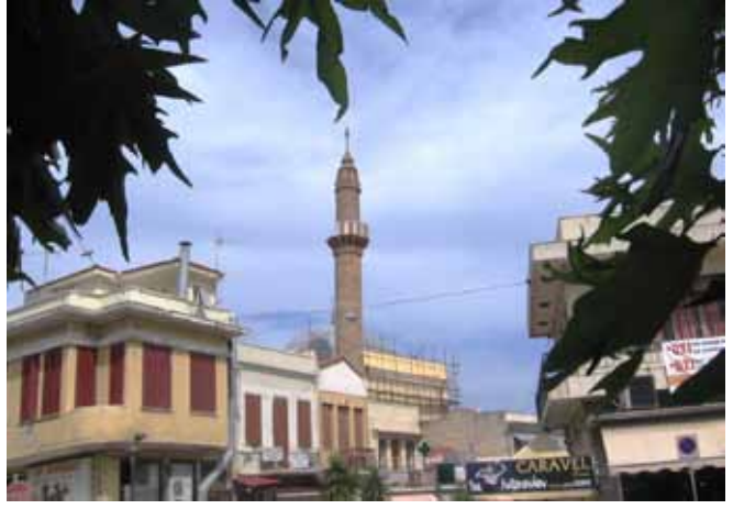
Sakız Adası Mecidiye Cami Bizans Müzesi olarak kullanılıyor.

Osmanlı döneminde Sakız’da 16 tane cami vardı. Bunlar: Sultan Süleyman Camii, Öküz Mehmet Paşa Cami, Kale Cebeciyan Cami, Salih Paşa Cami, Zeytinli Cami, Kaptan-ı Derya Gazi Piyale Paşa Cami, Salih Paşa Medresesi Cami, Tunus Valisi Abdurrahman Paşa Cami, tekke ve zaviye Cami, Şeyh İlyas Efendi Zaviyesi Cami, Hızır Baba Türbesi Cami, Bayraklı Cami, Mecidiye Cami, Hamidiye Cami, Osmaniye Cami, Orha-