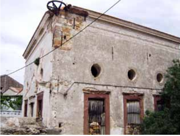
Sakız Adası Bayraklı Camii