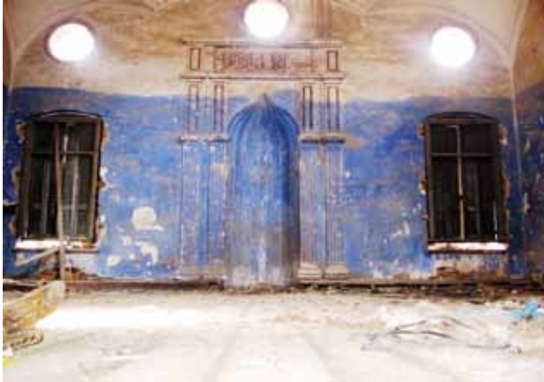
Sakız Adası Bayraklı Camii içi.

mevcuttur. Tuğra altında 1309/1891 tarihli 4X2 satırlık talik bir tamir kitabesi mevcuttur.