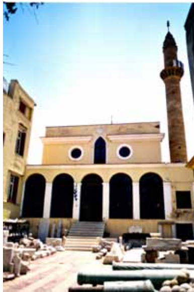
Sakız Adası Mecidiye Cami genel.