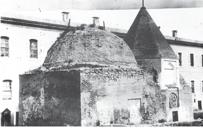
Ulvi Sultan Mescid ve Türbesi Hükümet Konağı'nın batı bitişliğinde olan bina, 13. yüzyılın sonlarında inşa edilmişti. 1924 yılında meydanı genişletmek amacıyla belediye tarafından yıkılmıştır.

lunduğu yerler üzerinde ayrıca durulacaktır. Hükümet binası yapılıncaya kadar, bu bölgede Şerafeddin Camii ile Kalecik Mahallesi arasında küçük bir de mahalle vardır. Bölgede birisi hükümet binasının önünde Ulvi Sultan Mescidi ve Türbesi, diğeri bugünkü PTT binasının karşısında, Kayalı Park'ın olduğu yerde olmak üzere iki mescit bulunmaktadır. Günümüzde mevcut Hacı Hasan Camii'nin batı tarafında ise Fethiye ve Karahafız Medreseleri yer alıyordu. Anlatıldığı şekilde bölge, tamamen tarihî bir bölgedir.