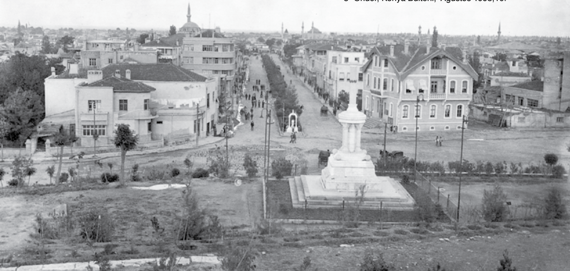
Alaeddin Caddesi açıldıktan sonraki durumu.