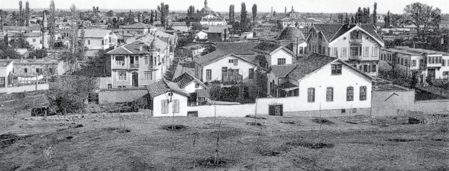
20. yy. başlarında Alaeddin Caddesi açılmadan önce.