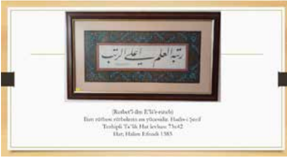
[Kıbrıs'ın E'W'v'v'v'v'] Elin rütbesi rütbesinin en yücüsünde. Hatlı: Şerif Tırahıqı Ta'ik Hat levhası 73x42 Hat: Hatim Efeendi 1383