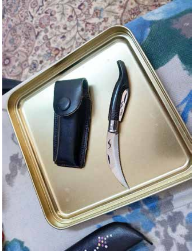
Çakı koleksiyonundan bir örnek