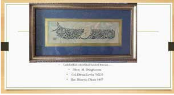
Latifullah'ın okullarını hatırlayan yazma... • Elini: M. Diğilimsoy • Gel: Kırsal Levha 70035 • Hat: Hüseyin Öksüz 1407