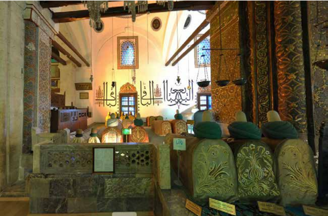
Ulu Arif Çelebi

Ulu Ârif Çelebi, Sultan Veled hayatta iken Emir Kayser Tebrizî'nin kızı Devlet Hatun'la evlenmiş, bu evlilikten Bahâeddin Emîr Âlim Çelebi, Muzaffereddin Emîr Âdil Çelebi ve Melike isminde bir kız çocuğu dünyaya gelmiştir.