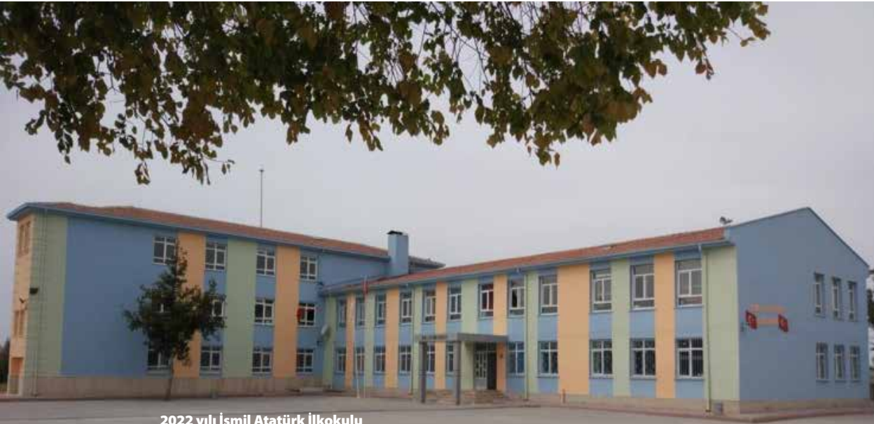
2022 yılı İsmil Atatürk İlkokulu

İsmil'e Kazak Türklerinin göç etmeleriyle yerleştikleri yıllarda (1955) bölgede okul ihtiyacı doğmuştur. Dönemin iç işleri bakanı