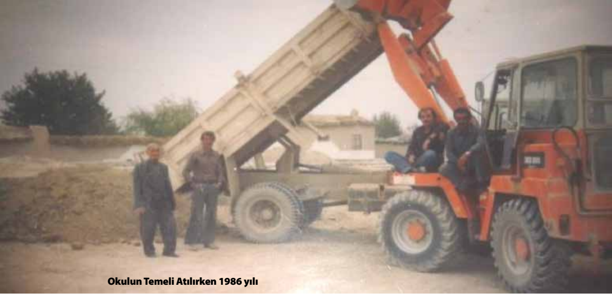
Okulun Temeli Atılırken 1986 yılı