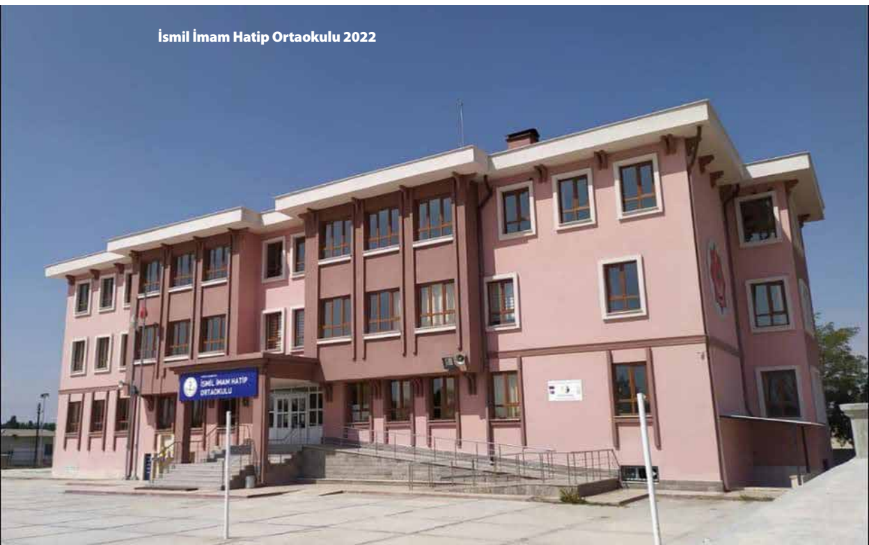
İsmil İmam Hatip Ortaokulu 2022