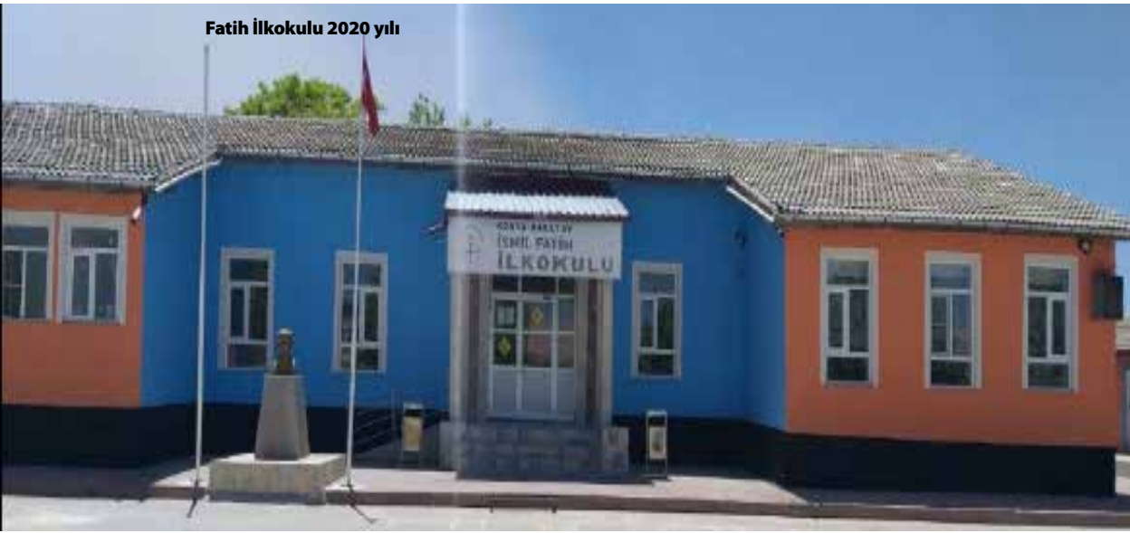
Fatih İlkokulu 2020 yılı